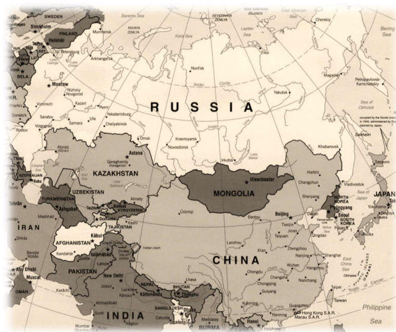
Kart 1: (Doyle 2007).

Kartet viser Øst-Europa og Asia. Det er det østlige grenseområdet mellom Russland og Kina og regionen det RFØ som oppgaven handler om.