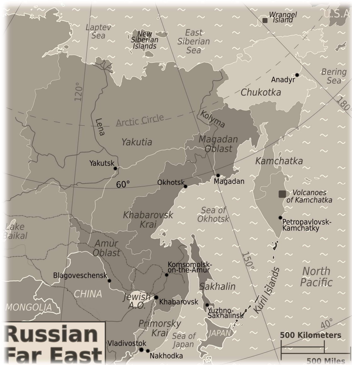
Kart 2: (Wikitravel 2017). Kartet viser regionen det RFØ.