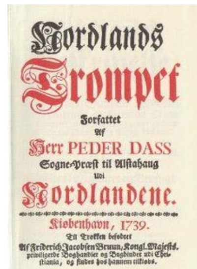
KØBENHAVN-UTGAVEN AV «NORLANDS TROMPET» (1739)

«Nordlands Trompet» er over hundre sider langt, og begynner med to innledningsdikt, som blir fulgt av selve hoveddelen, nemlig beskrivelsen av Nordlandenes amt. Hoveddelen begynner med den kjente hilsningsdelen, som blir etterfulgt av beskrivelser av Nordlands beliggenhet, amtets astronomiske og meteorologiske forhold,