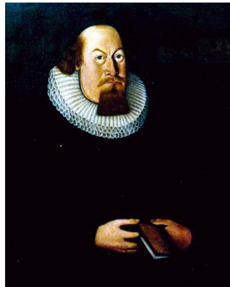
MALERI FRA 1684 I MELHUS KIRKE SOM LENGE HAR VÆRT ANTATT Å FORESTILLE PETTER DASS