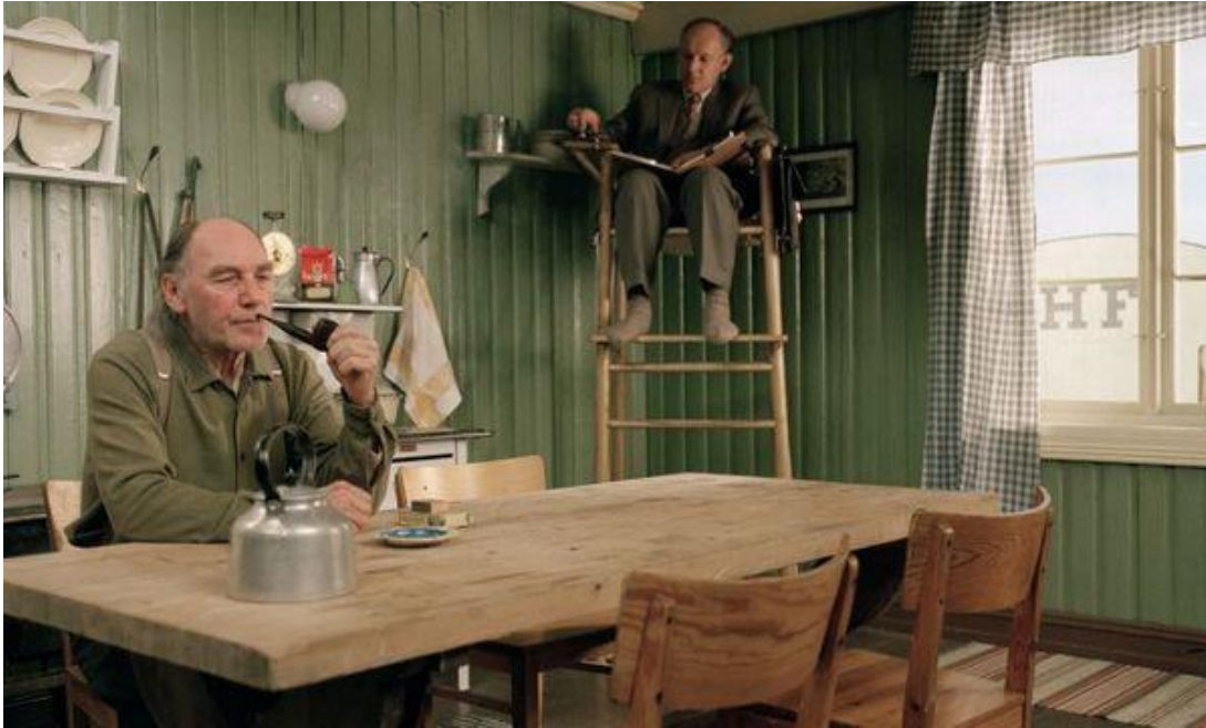
Fra: Salmer fra kjøkkenet