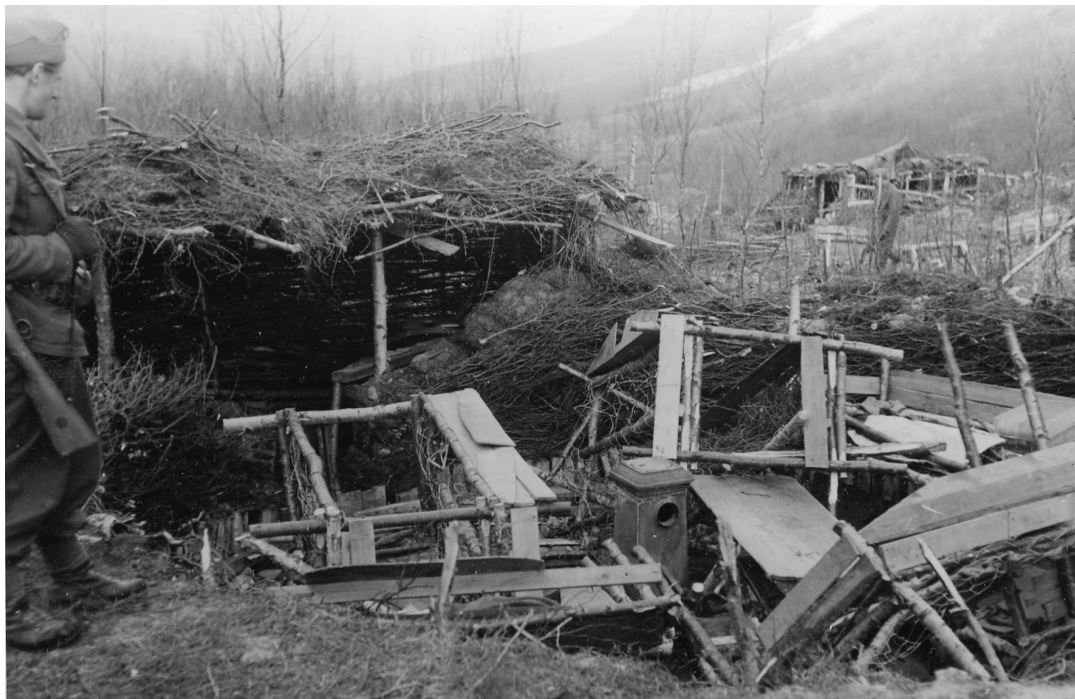
Figur 2. Fangeleiren Mallnitz, juni 1945. Mallnitz var leiren mange krigsfanger kom til, men som svært få forlot i live. Ovnene står ennå i dag, se figur 5.

og videreføring av den kulturelle arven er essensiell for vår felles forståelse av kulturarv (Arendt 1976:ix; Bangstad 2014:28-29). I Norge skapte etterkrigstiden og den kalde krigen en offisiell konsensus gjeldende okkupasjonsårene (Jasinski 2010:3), og tematikken ble aldri forløst, hvorpå mange av de problematiske aspektene rundt krigen ble fortiet gjennom en nasjonal og kanonisert erindring. Historieverk, dokumentarer og utstillinger har frem til nylig vært representert gjennom motstandskampen, det nasjonale og en konkret vestlig orientering, med et fokus på kampen mellom tyskerne og våre egne motstandsfolk, flyktingeløser og forkjempere (jf. Fjermeros 2013:260).