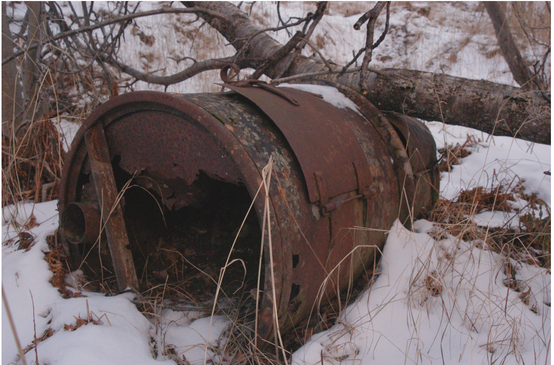
Figur 6. Den naturlige bevaringsformen har skapt en unik sammenblanding av natur og kultur i Norddalen.

som ruinenes progressivitet og aktive narrative egenskaper (Pétursdóttir og Olsen 2014b:4987) – egenskaper som er grunnleggende nettopp for hvordan vi kan oppleve den «lille historien».