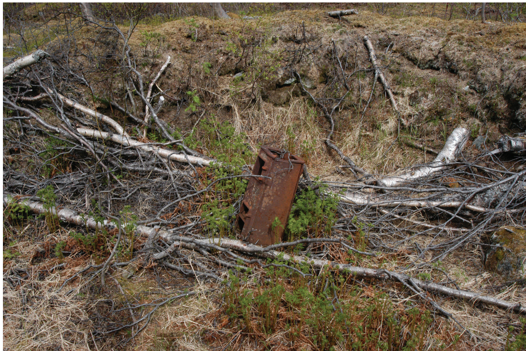
Figur 5. Krigens materielle spor er ennå tilstede i et uavklart og pågående forfall. En skjev ovn står ennå på plass i Mallnitz.

ryddet og iscenesatt, hvor man fjerner elementer som er tolket som fremmed (Pétursdóttir og Olsen 2014b:4989). I dette forsøker man også å fremme og innramme strukturene slik at bruks- og alderspreget blir avgrenset – man skaper noe som er gjenkjennbart og definerbart innenfor en moderne forståelse av kulturminner. Opplevelsesverdiene er satt i en kontekst som ønsker å skape undring, refleksjon og nysgjerrighet. Men, som jeg har argumentert med Järämä som eksempel, er dette problematisk. Hvis man søker å skape en opplevelsesverdi i Norddalen gjennom slike estetiske opplevelsesverdier, en rekondisjonering, gjør man det på bekostning av krigsminnenes egenhet og affektivitet – man gjør det motsatte av det man ønsker å oppnå. En tilrettelegging av eksempelvis Gastein vil utvilsomt endre stedet og måten vi opplever det. Selv om man kanskje klarer å gjøre lokaliteten mer «lesbar», innebærer det også en tilskyndet