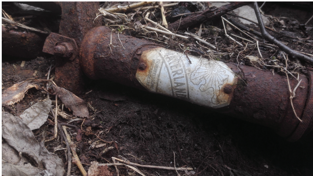
Figur 7. De affektive og særegne aspektene til ting er i et stort mangfold i Norddalen. Sykkel fra fangeleiren Spittal.

lever i beste velgående. Å forsøke å temme slike dissonerende kulturminner, underlegge dem krav og retningslinjer som i all hovedsak renser dem for sin pågående tilstedeværelse, er å trivialisere dem for det de er.