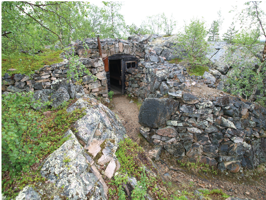
Figur 3. Restaurerte dekningsrom ved Järämä.

nedene 1944/45, er de fysiske fremstillingene og de rekonstruerte delene av tyskernes forsvarsstilling retusjert og temmet.