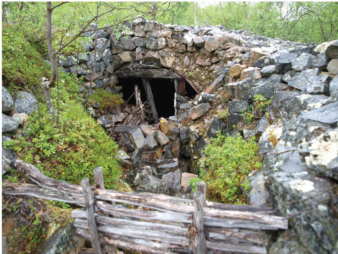
Figur 4. Dekningsrom i sitt naturlige livsløp ved Järämä.

kulturminnevernet utgjøre en fare gjennom å omskape disse materielle vitnesbyrdene til banale og ferdigtolkede steder som skal produsere og fremprovosere minner. Resultatet kan bli en overdokumentert fremstilling av en lokalitet som nøytraliseres og steriliseres gjennom tap av sin egenhet, annerledeshet og affektivitet (Buchli og Lucas 2001:9-10; González-Ruibal 2008:261; Olivier 2011:56-57). De kan og i verste fall ødelegge hva stedet faktisk er (Olivier 2001; Kobiałka 2014:362).