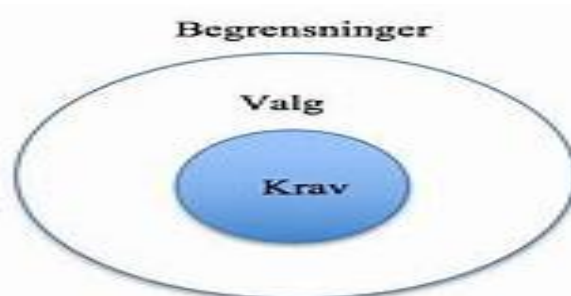
Figur 2 - Stewarts analysemodell (1982, 1989).

Slik vi forstår modellen, vil den i praksis være et styrende verktøy for at enhetsledere i samarbeid med pedagogiske ledere skal kunne lage grunnleggende formelle organisatoriske rammer i barnehagen. Figuren viser at handlingsrommet bestemmes av de fullmakter en som leder har, i tillegg krav, og rammer. Handlingsrommet utøves i hovedsak av øverste ledelse i organisasjonen.