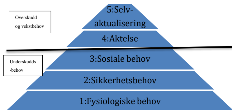
Figur 1: Maslows behovshierarki (Maslow, 1954, s.35-51).

Abraham Maslow mente at menneskets behov kunne deles inn i fem hovedkategorier vist i figur 1, med to hovedtyper innenfor de fem hovedgruppene: behov for underskuddsdekning og behov for vekstmuligheter. Behovene ble organisert i et behovshierarki der de laveste behovene, kalt underskuddsbehov, måtte være tilfredsstilt før det var mulig å avansere til overskuddsbehov (Maslow, 1954, s.35-51).