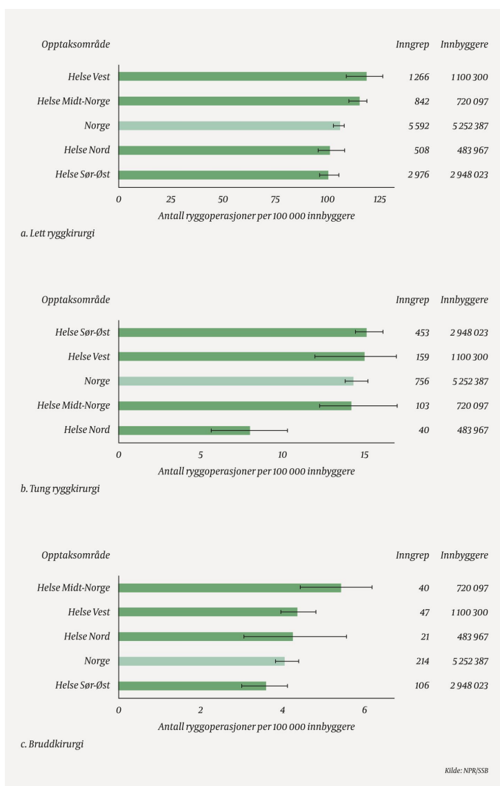
Figur 1 Gjennomsnittlig antall ryggoperasjoner per 100 000 innbyggere per år i perioden 2014–18, standardisert for kjønn og alder, fordelt på helseregionene som boområder for a) lett og b) tung ryggkirurgi for degenerative ryggglidelser samt c) kirurgisk behandling av brudd i ryggen. Intervallet viser variasjonen i årlig rate, fra lavest til høyest. Merk at skalaen på x-aksen varierer mellom delfigurene.

Forskjellene i gjennomsnittlige behandlingsrater mellom boområdene i Helse Nord var moderate, men det var stor årlig variasjon i noen boområder (figur 2). Bosatte i lokalsykehusområdet Bodø hadde fra og med 2015 konsistent lavere rate enn landsgjennomsnittet med gjennomsnittlig 86 operasjoner per 100 000 innbyggere per år (72 % av landsgjennomsnittet).