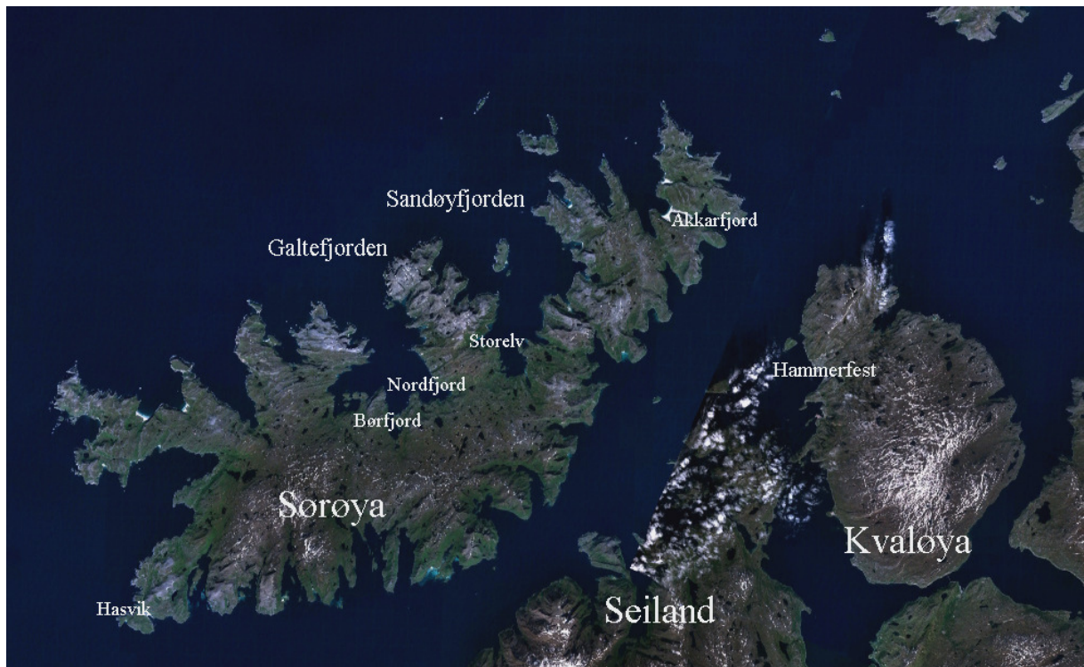
Sørøya med de aktuelle fjordene og stedsnavnene avmerket. Bearbeidet kart fra NASA (fri copyright)