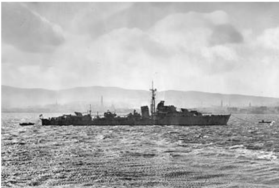
HMS «Zealous» i Skottland kort tid etter Sørøya-aksjonen.

Samlet sett vil jeg si at operasjonen var særegen i og med at de allierte risikerte livene til rundt 900 marinefolk, og eksistensen til fire slagkraftige krigsskip, for å berge ut 502 sivile nordmenn som var strandet i ingenmannsland mellom de tyske og russiske fronter. Ikke bare ville det potensielle tapet av fire jagere med mannskaper i seg selv vært et tungt slag for de allierte, men tapet av deres tilstedeværelse i konvoi beskyttelsen ville også ha ført til at risikoen de gjenværende skipene løp under returreisen fra Nord-Russland ville økt betraktelig. Dette var ikke, som har blitt hevdet i en del norsk litteratur, en operasjon utført med liten risiko og en enkel måte å vinne en propagandaseier i slutfasen av den andre verdenskrig. Operasjonen var risikabel, ikke minst fordi den foregikk i dagslys og uten noen form for støtte unntatt den som krigsskipene kunne yte til hverandre. Dette var britene fullstendig klare over, særlig når det gjaldt de tyske flystyrkene i Nord-Norge. Likevel ble operasjonen gjennomført, og 502 av de sivile flyktningene på Sørøya brakt ut og tatt med til Skottland via Murmansk. I denne sammenheng er naturlig å gå videre inn på saken for å forsøke å klargjøre hva som kunne ha motivert britene til å gjennomføre en slik operasjon, etter å ha avslått så mange tidligere forslag fra de norske myndighetenes side.