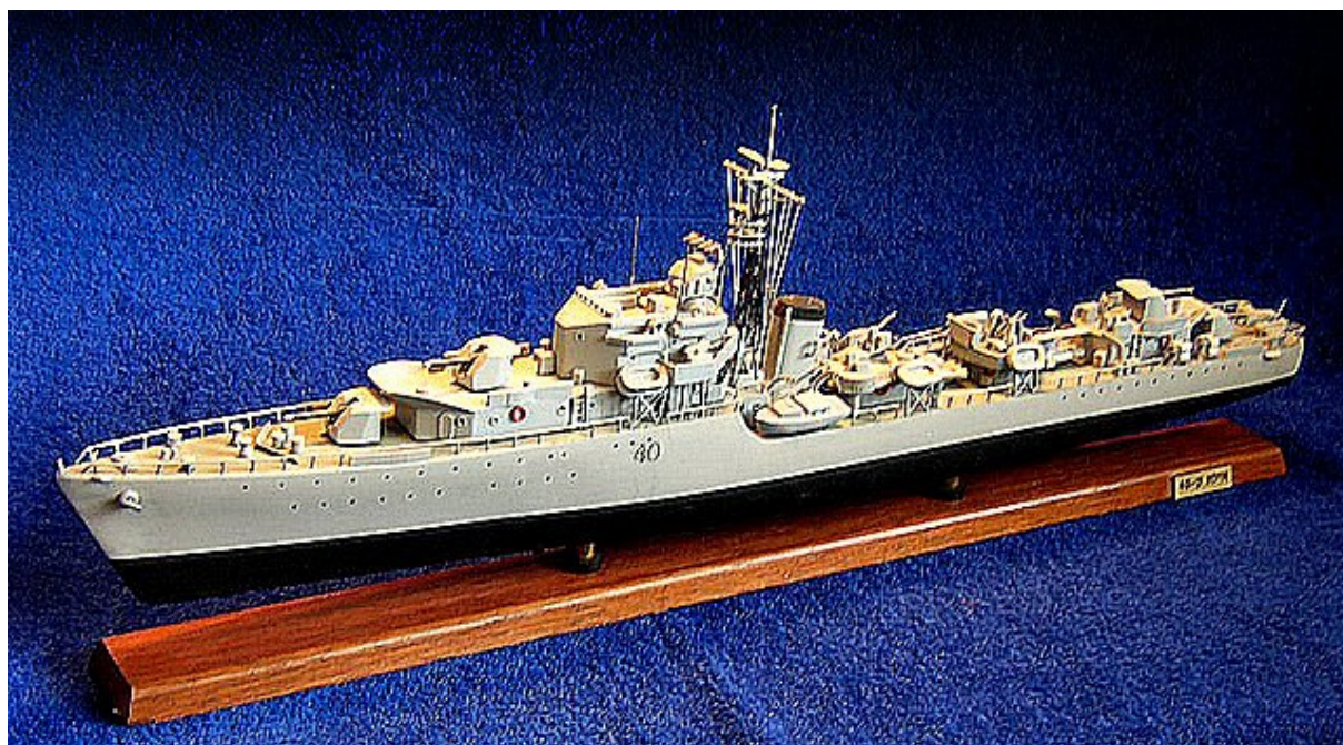
Modell av HMS «Zealous» av David Taggar, bilde frigjort av rettighetsinnehaver via Wikimedia Commons.

For å vurdere innsatsen til britene i operasjonen, og den egentlige risikoen de løp vil jeg se nærmere på de militærenhetene som ble sendt inn til Sørøya den 15. februar 1945. Skipene som anløp fjordene på utsiden av Sørøya for å foreta evakueringen var såkalte jagere, altså mellomstore skip bygget fortrinnsvis til eskortetjeneste. Denne skipstypen kunne også benyttes til selvstendige operasjoner på grunn av en relativt god ildkraft. Under den andre