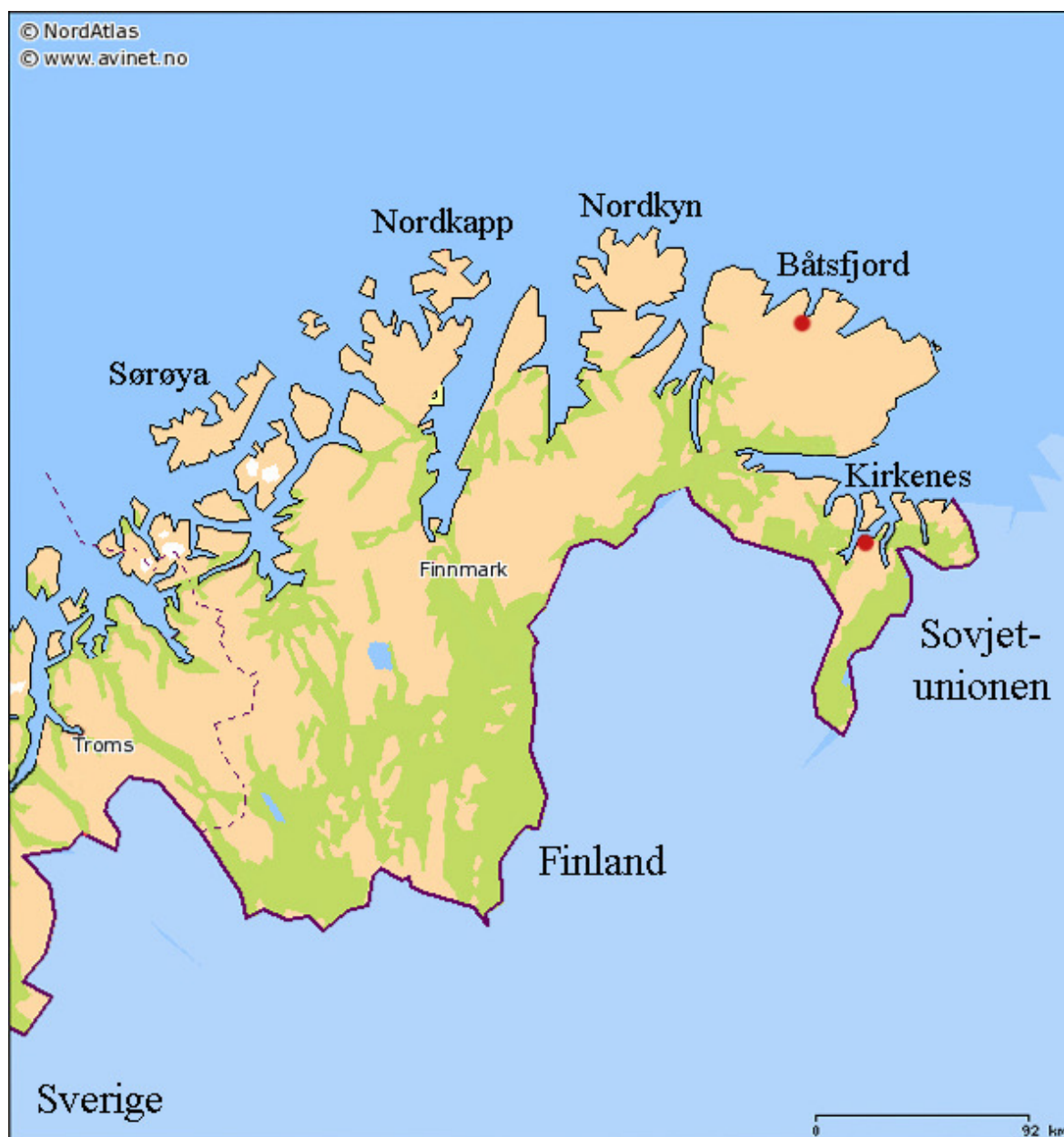
Finnmark og Nord-Troms med aktuelle steder avmerket, Kirkenes og Båtsfjord med røde markører. Kart fra Nordatlas.no, ikke-kommersiell bruk tillatt.

frigjort norsk område. 112 Noen dager senere fikk Sørøy-folket kontakt med de norske militære, og informerte dem om situasjonen på Sørøya. I første halvdel av januar 1945 kom ytterligere to skøyter til Båtsfjord, disse med 36 flyktninger fra Sørøya. På bakgrunn av hva folkene som hadde klart å komme seg bort fra Sørøya hadde å fortelle ble det fra norsk militært hold satt i gang planlegging av en hjelpeaksjon. 113 På naboøya Seiland var situasjonen enda mer kritisk forsyningsmessig, og den gjenværende befolkningen der ble også omfattet av den påfølgende aksjonen. 114