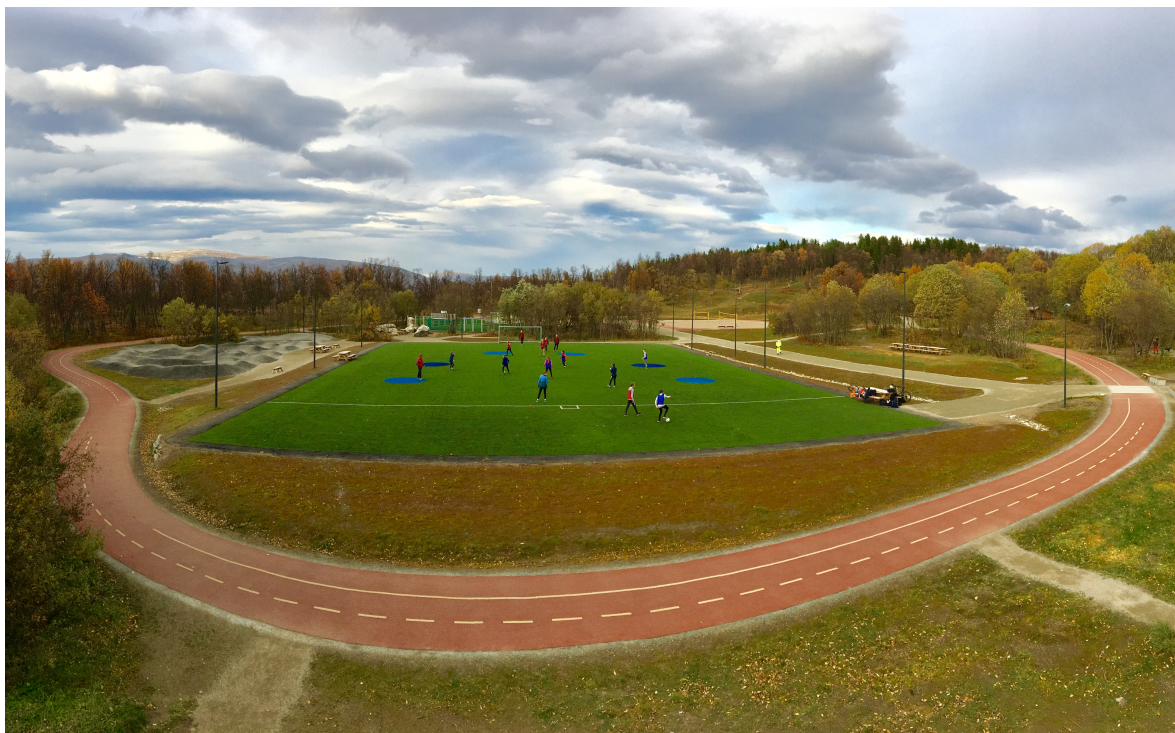
Figur 3. Bilde som viser den multifunksjonelle banen på Charlottenlund i Tromsø.

Ved å tøyne elastikken og bryte med de kjente rammene åpnes det opp for at den enkelte kan finne alternative måter å ta i bruk byrommet på. Et eksempel der denne metoden har blitt tatt i bruk er på den multifunksjonelle banen på Charlottenlund i Tromsø. Der er banen designet slik at det ser ut som en blanding av fotballbane, slåballbane og lekeplass, med kun ett fotballmål. Dette er i utgangspunktet et lite fysisk inngrep, men et inngrep som faktisk endrer rammen for bruk. Det vil som følge av endringen oppstå et behov for å tenke annerledes om hvordan banen skal benyttes. I tillegg til at det ene målet er fjernet er det flere områder med sirkler i ulike blånyanser som er felt inn i gressmatten. Disse sirklene bidrar også til at banen skiller seg fra den tradisjonelle fotballbanens stramme utforming, tilrettelagt for lite variert bruk. Med hensyn til variasjon i byrommet finner en også den tradisjonelle fotballbanen på Charlottenlund. Like bortenfor den mer elastiske utformede banen finner vi en tradisjonell ballbinge med den velkjente, stramme utformingen med to mål, grønn gressmatte og hvite kantlinjer.