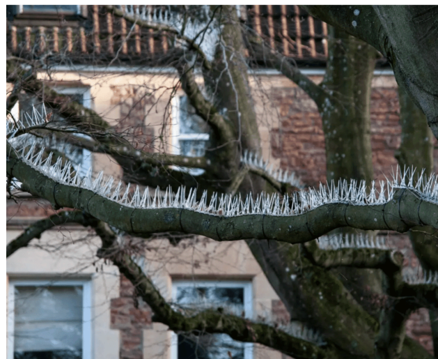
Figur 5. Fiendtlig arkitektur som rammer dyrelivet.