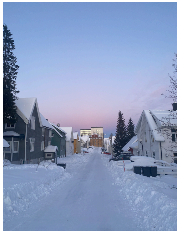
Figur 2. En vinterdag i Tromsøs gater, 2022.

tilrettelegge for turistnæringen, men samtidig beholde «sjelen til byen» og sikre vitalitet og inkludere lokalbefolkningen. Det har vært mange meninger, som både har vært positive, og negative til å utvikle Tromsø som turistby. Diskusjonene har blant annet omhandlet hvordan turistbyen tapper sentrumsområdet for levde kvaliteter i hverdagsbyrommet for