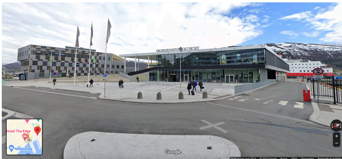
Figur 8. Oversiktsbilde av torget på Prostneset og havneterminalen.

brukt til å trekke opp kirkebåtene (Ytreberg, 1946). I 1862 kjøpte kommunen prestegården med den tilhørende prestegårdshavnen på auksjon og siden den gang har området vært åpent for den allmenne befolkningen i Tromsø (Ytreberg, 1946). Torget som er et av byens viktigste knutepunkt, og som binder vann, land og distrikt sammen, har ikke et offisielt navn og går derfor under navnet Torg 1, Prostneset. Prosjektet Inkluderende Arktiske byrom satte i den forbindelse i gang en medvirkningsprosess der målet var å hente inn ulike navneforslag som senere ble presentert for Tromsø havn og Tromsø kommune. Dette ble gjort ved å sette opp en egen stand på byromsfest der alle kunne skrive ned sine forslag og henge de opp på et blankt lerret plassert ute på torget. Det ble i tillegg lagt ut et innlegg på sosiale medier der de som ikke hadde mulighet til å delta på byromsfesten fikk anledning til å komme med sine navneforslag. Forslagene som kom inn var både mange og gode, men i skrivende stund er det enda ikke foretatt et endelig navnevalg for dette torget.