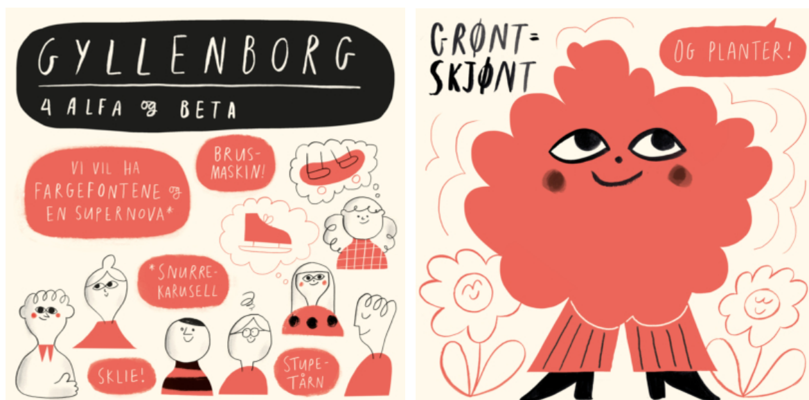
Figur 10. Visuell presentasjon av noen av innspillene fra innsiktsworkshop med barn og unge. Illustrert av Liv Ragnhild Kjellmann.

Men det er også utfordrende å love noe. I retrospekt ser jeg at det ikke er mulig å realisere alt. Hva lovte vi og hva skjedde? Det er også viktig å trekke frem hvorfor det kan være risikabelt med brede medvirkningsprosesser, fordi en kan ikke realisere alle forslagene og noen kan derfor bli skuffet. Innspillene som NODA fikk resulterte i en paviljong, og for barn spesielt, kan det være vanskelig å gjenkjenne sine innspill og se hvilke kvaliteter en slik paviljongen tilfører byrommet. Forslagene til deltakere som var med på de ulike innsiktsworkshopene var både kreative og morsomme, men det er ikke mulig å realisere alle, men de ga likefullt et godt bilde av mulighetsrommet som finnes og særlig hvilke ønsker lokale barn og unge har. Til sammen ble det gjennomført seks slike innsiktsworkshoper med ulike grupper og klasser i ulik alder. Totalt resulterte det i nesten 140 deltakere som delte sine ønsker og tanker for byrommet Prostneset. Alle innspillene ble skrevet ned og videreformidlet til formgiverne slik at de hadde et utgangspunkt å jobbe med, da de skulle i gang med å tegne sine forslag til det fysiske tiltaket som senere skulle bygges. Også Tromsø kommune fikk disse innspillene. Selv om innspillsprosessen bestod av ulike grupper var essensen i innspillene relativt samstemte. Det var et klart ønske om skjermede sitteplasser hvor en kunne sitte ned og prate andre. Samtidig som torget måtte ha mer farger og inneha kvaliteter som tilrettelegger for lek.