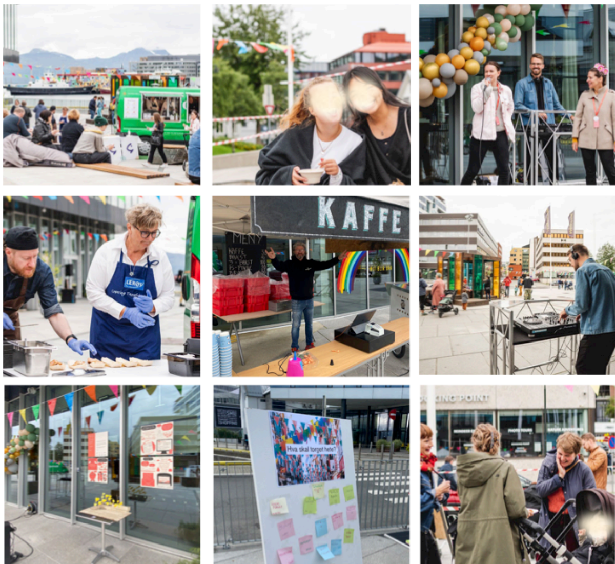
Figur 1. Bildesamling som viser et fargerikt utvalg fra noe av det som foregikk under byromsfest i Tromsø sentrum, 2021.

«Byrom er veldig spennende og særlig Arktiske byrom, men de er også preget av mye vær og et tøft klima, og kan tidvis virke lite inviterende både for innbyggere og besøkende. Mange offentlige rom i nord er svært attraktive på varme sommerdager, men når vinteren kommer står disse arealene ofte mer ubrukte og fremstår som utilgjengelige for byens befolkning og tilreisende turister. Blomsterkasser, lekeapparater og benker ligger under snøen, mens folk trekker inn. I mørketiden begrenses ofte møtene mellom folk ute. Det er derfor behov for flere attraktive uterom i denne delen av året, arealer, som kan ivareta mangfoldet og bidra til inkludering– og ivareta de mellommenneskelige møtene i kulden og mørket. Byrommene er felles sosiale møteplasser som tilhører alle, og som bidrar til å skape identitet gjennom utforming og særpreg. De arktiske byrommene er mulighetsrom med et stort utnyttet potensial» (NODA, 2021a).