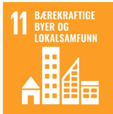
Figur 13. FNs bærekraftsmål nummer 11.

I denne sammenhengen vil jeg trekke frem FNs bærekraftsmål nummer 11. Dette bærekraftsmålet handler om byer og lokalsamfunn der målet er å utvikle inkluderende, trygge og bærekraftige byer og lokalsamfunn. I delmålene 11.3 og 11.7 fokuseres det på bærekraftig urbanisering og fremme viktigheten av deltakende, inkluderende og bærekraftig samfunnsutvikling, i tillegg til universell utforming og tilgjengelighet for alle. Disse målene har også vært gjeldene for prosjektet Inkluderende Arktiske byrom.