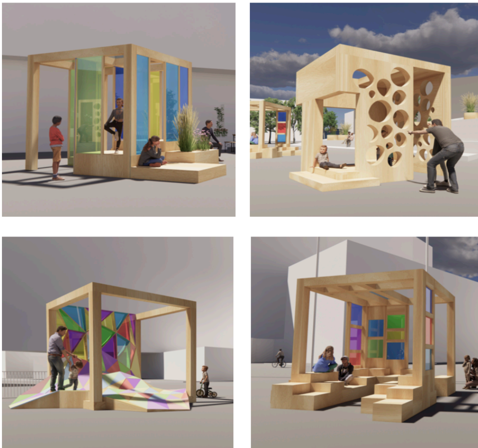
Figur 12. Illustrasjon av de fire paviljongene som kom frem på workshop med lokale formgivere.

Prosjektets ressurser gjorde det dessverre ikke mulig å realisere begge forslagene, det ble derfor gjort en avstemming over hvilke av forslagene som skulle jobbes videre med. Denne diskusjonen dreide seg om å trekke ut de beste kvalitetene fra de ulike prosjektene og sammen komme til enighet, noe som ble svært utfordrende fordi begge gruppene ønsket selvsagt å realisere sin visjon. Etter flere diskusjoner kom gruppene til enighet og stemningen i rommet tilsa at alle var fortrolig med de endelige beslutningen og visjonene som skulle jobbes videre med, og planlegges i detalj. Oppgaven med detaljtegning ble gitt til formgiverne i sin helhet som selv satte sammen et team, og hadde i oppdrag å ferdigstille tegningene av paviljongene slik at de kunne bygges. Utfordringen med å gi en slik oppgave til samme personer som har vært med på workshop og har eierskap til sine ideer er at deres personlige visjoner og ønsker kan bli vektlagt i større grad enn innspillene som er hentet inn.