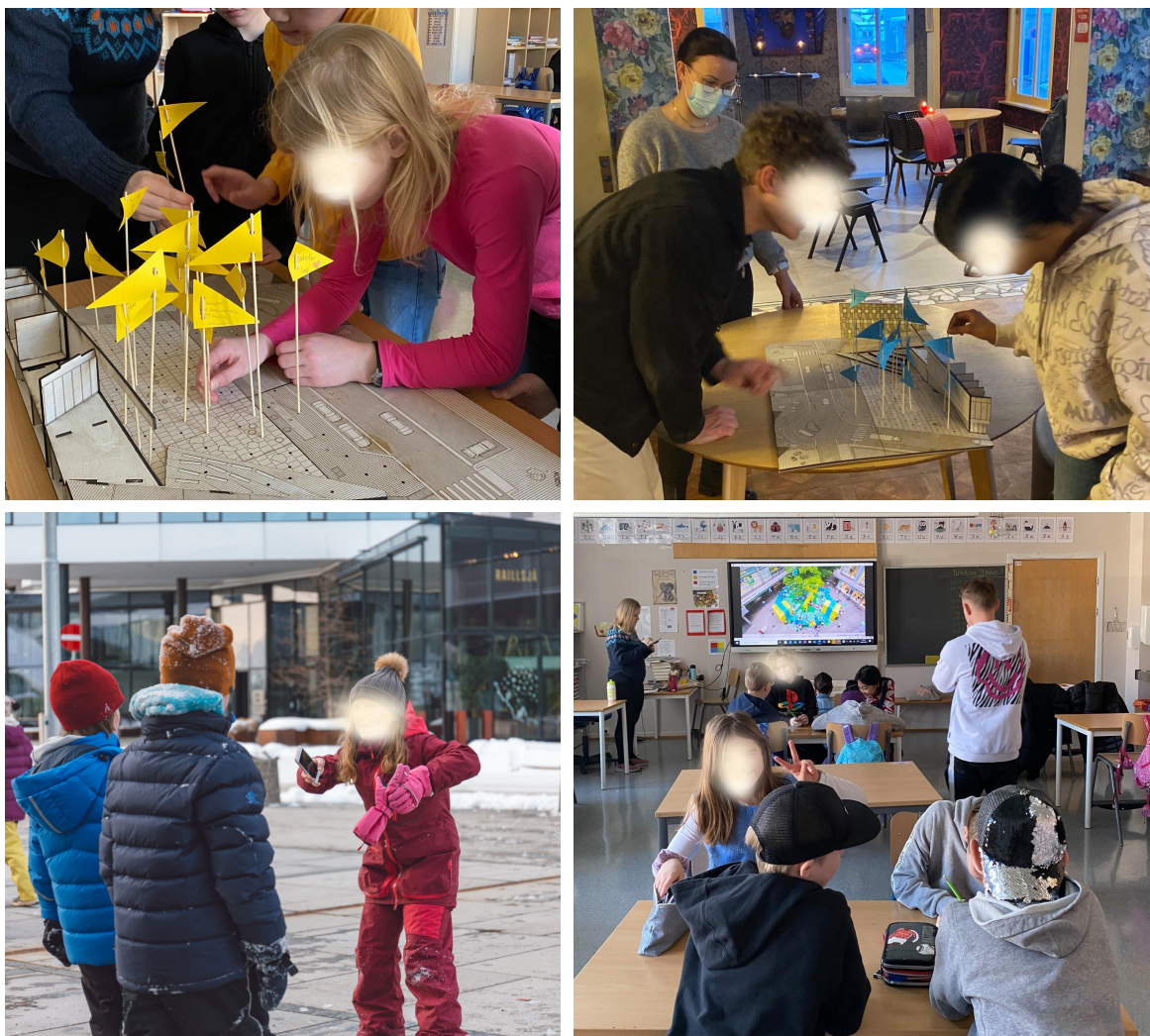
Figur 6. Bilder fra innsiktsworkshops og på befaring i innsiktsfasen.

Valget av informanter til denne oppgaven henger tett sammen med prosjektets målgruppe som består av et mangfold av brukergrupper med interesse for arktiske byrom, og et særlig fokus har blitt rettet mot inkludering av barn og unge. Informantutvalget er dermed styrt på bakgrunn av hvem som har deltatt på prosjektets ulike arrangementer. Det er viktig å presisere at jeg ikke har informanter under 16 år. Informantene er voksne personer knyttet til prosjektet. Barna som deltok på innsiktsworkshop er ikke med i utvalget av informanter, og jeg benytter kun det offentlige materialet som er produsert, og som NODA har publisert. De jeg har snakket- og diskutert med underveis i prosjektet er voksne personer og datamaterialet jeg bruker er resultatene som er offentlig tilgjengelig.