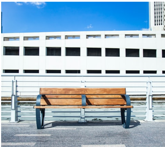
Figur 4. Fiendtlig arkitektur som rammer mennesker.