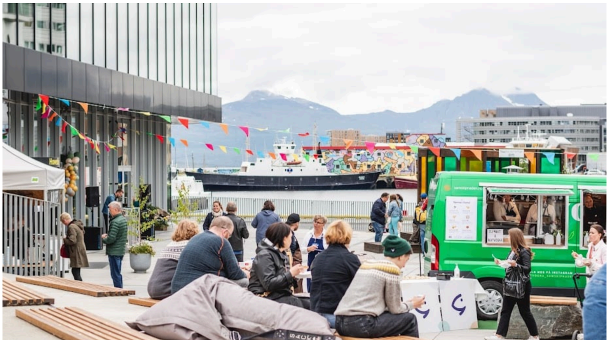
Figur 14. Stemningsbilde fra amfiet under byromsfesten til NODA.

sakte, men sikkert opp av muntre ansikter, noen med brede smil og høylytt latter, andre med usikkerhet i blikket. Hvordan forholder man seg egentlig til en slags fest midt på dagen lurte kanskje noen? Det ligger kanskje heller ikke i den norske kulturen å danse fritt på torget midt på høylys dag. Men flere av de usikre ansiktene gikk etter hvert over til trygge smil ute på det temporære dansegulvet. Lukten av nystekte kanelboller, traktekaffe og de blide ansiktene fylte sansene og jeg tenkte tilbake på alle bekymringene omkring hvordan byromsfesten skulle bli tatt imot med et lettelsens sukk. Selv om godværsstyene etter hvert forsvant og gradestokken ikke viste mer enn snau 10 grader, var atmosfæren varm, og det følte betraktelig varmere. Jeg pratet med flere av de besøkende som tilsynelatende virket til å trives godt på byromsfesten. «Jeg er normalt ingen danser, men i dag følte det naturlig å ta med datteren og delta på danseleken da anledningen bød seg», sa en av mødrene mens hun så på barna som løp rundt og rundt på paviljongen sammen med andre barn. «Ja, det va no artig» legger ei annen til. Et annet par jeg kom i prat med hadde med seg en liten valp som for første gang fikk oppleve noe av hva Tromsø sentrum har å by på. «Dette var en fin måte å sosialisere Fia på» mente de.