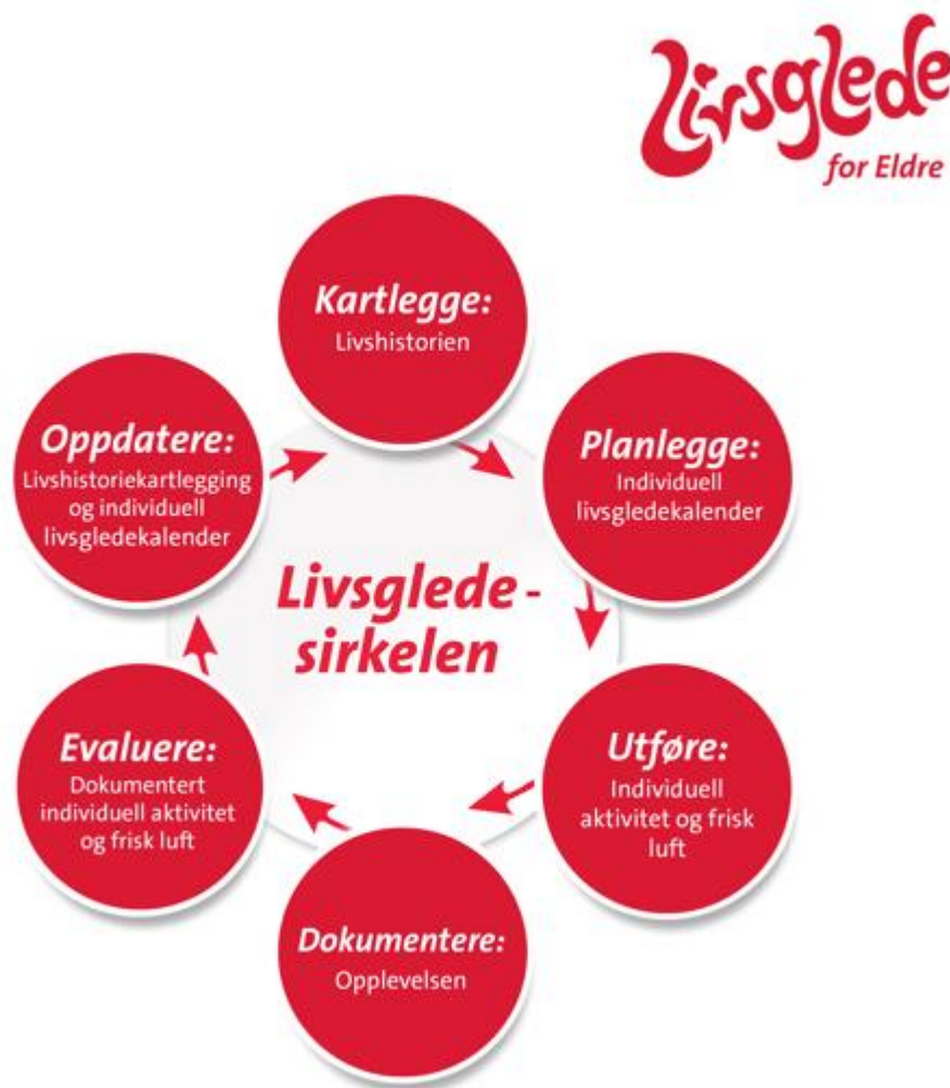
Figur 1: Livsgledesirkelen gjengitt etter tillatelse fra LFE (ny versjon fra 2022)

Livsgledesirkelen (Figur 1) består av seks trinn som skal jobbes med i en kontinuerlig prosess, og skal sikre at personalet jobber personsentrert i praksis, med fokus på pasientens egne opplevelser, evner og helsetilstand. Livsgledesirkelen er utarbeidet av LFE og illustrerer prosessen i livsgledearbeidet (Lundemo et al., 2020, s. 13).