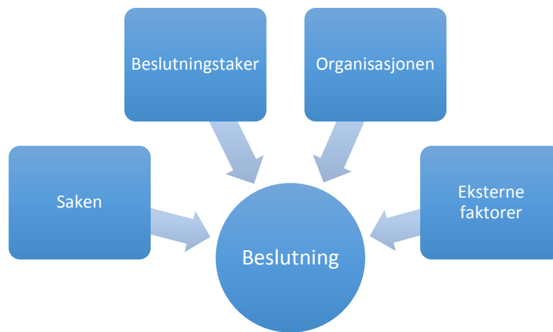
Figur 2: Økologisk beslutningsmodell (Baumann, m.fl, 2011)