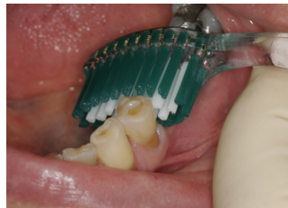
Puss alle sider av tennene