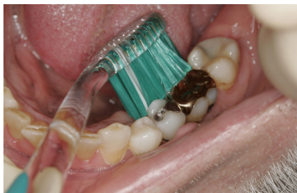
Puss på innsiden av tannrekkene