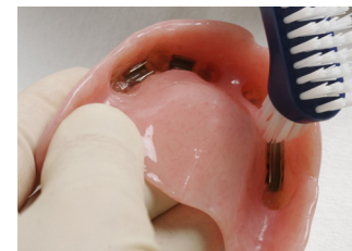
Rengjør innsiden av tannprotesen