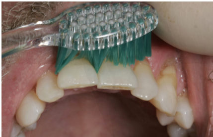
Puss på utsiden av tannrekkene

Tennene bør pusses 2 x daglig med en liten, myk tannbørste eller en elektrisk tannbørste Bruk fluortannkrem