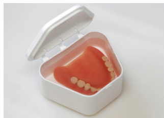
Legg protesen i en egnet boks uten vann når den ikke er i bruk