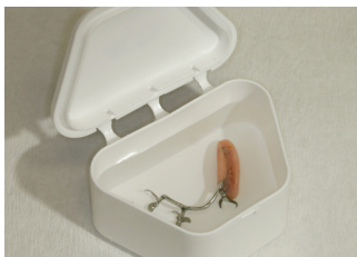
Protesen oppbevares i en egnet boks uten vann når den ikke er i bruk