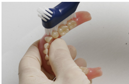
Tannprotesen rengjøres på innsiden og på utsiden