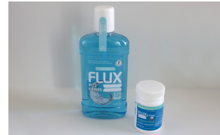
Ekstra bruk av fluor