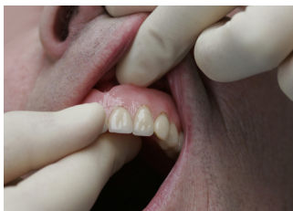
Ta ut tannprotesen (gebisset)

Tannprotesen tas ut og rengjøres 2 x daglig. Implantatene (skruene) rengjøres 2 x daglig med en liten, myk tannbørste/elektrisk tannbørste og mellomromsbørster eller solobørste