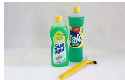
Tannprotesen kan rengjøres i husholdningsåpe