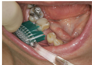
Puss på utsiden og på innsiden av tannrekkene