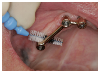
Rengjør under implantatene om mulig