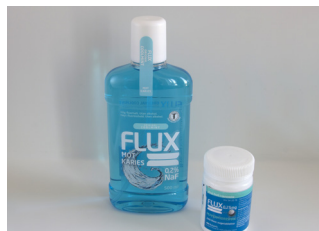
Ekstra bruk av fluor