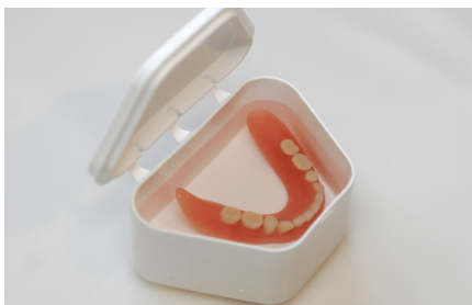
Tannprotesen oppbevares i en egnet boks uten vann når den ikke er i bruk