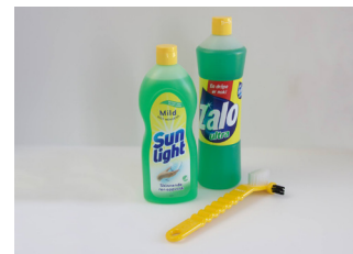
Delprotesen kan rengjøres i husholdningsåpe