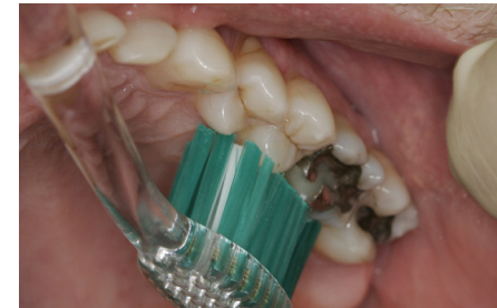
Puss på innsiden av tannrekkene