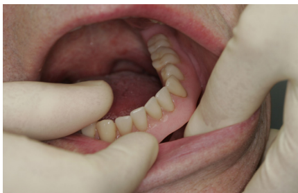
Ta ut tannprotesen/gebisset

Tannprotesen tas ut og rengjøres 2 x daglig. Implantatene (skruene) rengjøres 2 x daglig med en liten, myk tannbørste/elektrisk tannbørste og mellomromsbørste eller solobørste