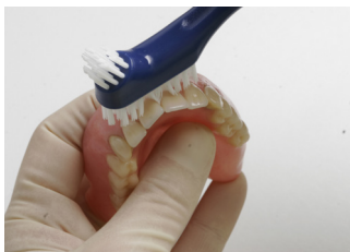
Rengjør utsiden av tannprotesen