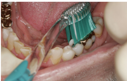
Puss alle tyggeflatene