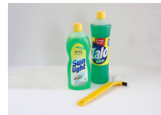
Tannprotesen kan rengjøres i husholdningsåpe