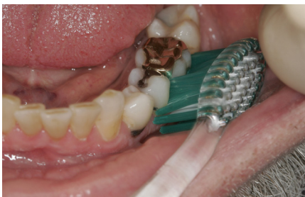
Puss på utsiden av tannrekkene

Tennene bør pusses 2 x daglig med en liten, myk tannbørste eller en elektrisk tannbørste Bruk fluortannkrem