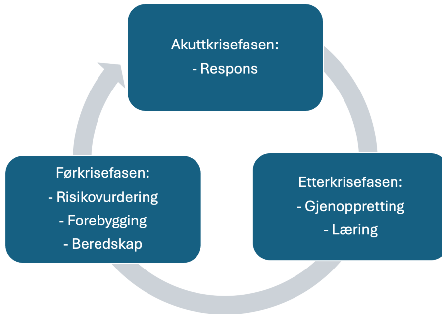
Figur 4 – Fremstilling av krisefasene med tilhørende aktivitet for krisehåndteringsarbeid

Krisehåndteringssirkelen er en kontinuerlig sirkel, uten en klar begynnelse eller slutt, hvor fasene eller aktivitetene i sirkelen gjerne kan overlappe (Pursiainen, 2018, s. 167). Fasene i sirkelen, slik som illustrert i figur 3, er: forebygging – beredskap – respons – gjenoppretting – læring – risikovurdering. Det betyr at krisehåndteringsarbeidet ikke står som enkeltstående aktiviteter, men inngår i hverandre og bør arbeides med kontinuerlig. Fasene i krisehåndteringssirkelen kan relateres til en krises faser.