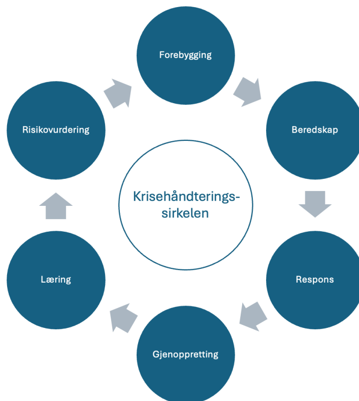
Figur 3 – Krisehåndterings-sirkelen