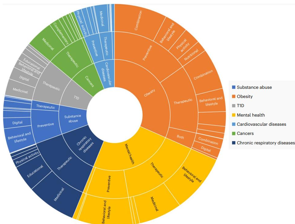
Figur 1: Oversikt over forskningstema om ungdom (Salam et al., 2024, s. 293)

Samfunnsvitenskapelig forskning på barn og unge bidrar til å forme våre forståelser, og kan dermed brukes som grunnlag for politiske beslutninger i form av politikk, tiltak og tjenester i profesjonsutdanningen og praksisfelt (Hagen & Lyng, 2019, s. 7). I Norge, som er en velferdsstat, har vi flere velferdsordninger og tjenester rettet mot barn og unge. God forskning på de ulike områdene kan blant annet bidra til å forbedre og videreutvikle disse ordningene, som igjen er nødvendig i takt med samfunnsendringene. Uten god forskning på område, kan det svekke vår allmennkunnskap og forståelse av tema, og den behandlingen ungdommene kan oppsøke, vil ikke bygge på faglig kvalitet. Etter hvert som samfunnet utvikler og endrer seg er det stadig behov for nyere og oppdatert forskning på området.