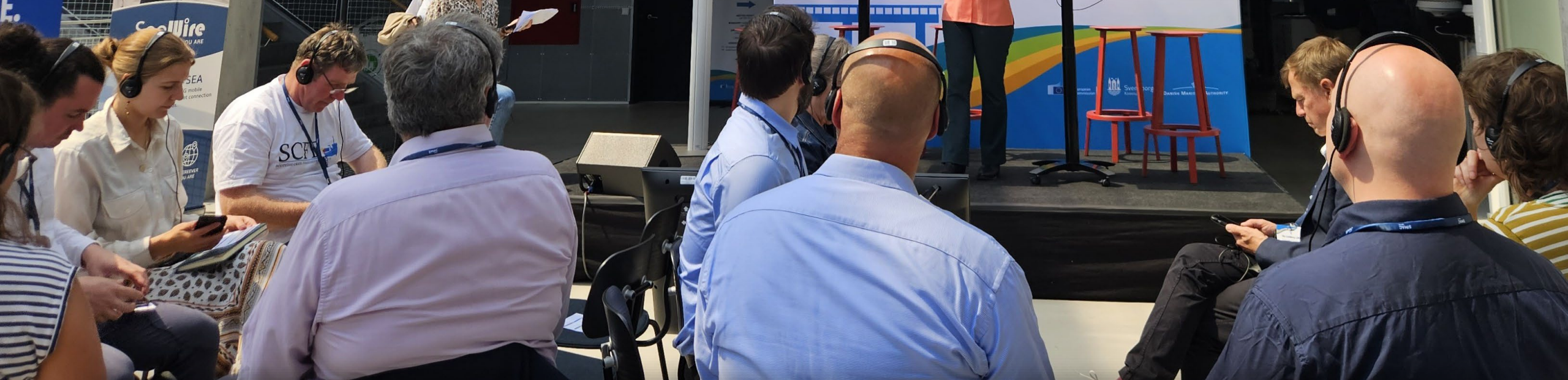
Diskusjon om framtidens fiskeri på EUs Maritime Day i Svendborg i Danmark i mai 2024