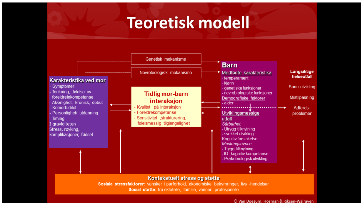
Figur 1. Oversatt fra artikkelen “ A model based intervention for depressed mothers and their infants” (15). Benyttet med tillatelse fra hovedforfatter Karin van Doesum.

Selv om det etter hvert er god dokumentasjon på hva som kan være effektiv behandling av sykdommen depresjon og forstadier til sykdom, er ikke kunnskapsgrunnlaget like klart med hensyn til om disse metodene er hensiktsmessige å benytte i primærforebygging av lidelsen, og på hvilken måte det er best å organisere dette. Dette forholdet påpekes i en Cochrane review publisert i 2013 (17), der noe av utgangspunktet er at kunnskap om behandling av depresjon teoretisk sett kan være nyttig med hensyn til hvordan man kan forebygge tilstanden. I en rapport fra Folkehelseinstituttet (18) fremheves viktigheten av også å sette fokus på samfunnsforhold som gir grobunn for utvikling av depresjon hos enkeltindivider. Dette er forhold som dreier seg om sosial ulikhet, arbeidsledighet, marginalisering av innvandrere og mindre velfungerende nærmiljøer (18). Den teoretiske modellen i figur 1 (15) illustrerer også tydelig at faktorer og