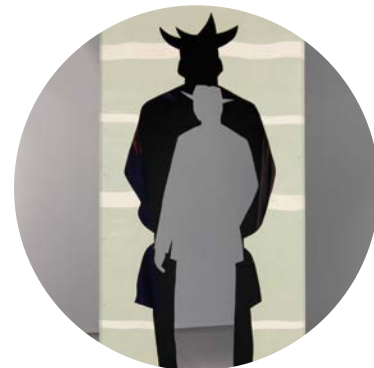
Aage Gaup, Skifte , skulpturinstallasjon. Detalj.