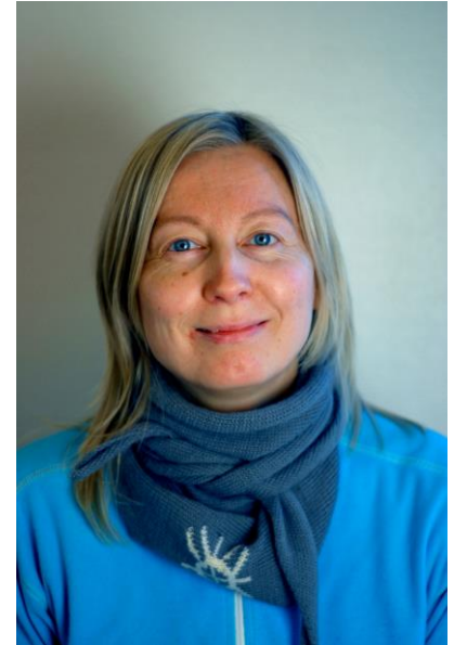
Biret Anne Bals Baal Dutki