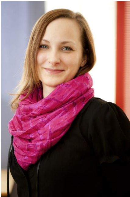
Biret Ellen Aina Siri Bals Prošeaktamielbargi