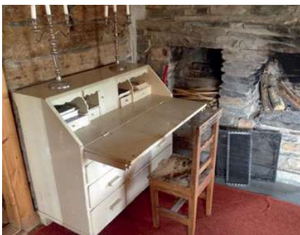
Ved varmen i bålhuset kan vi tenke oss at de første vekkekelsesprekener ble skrevet.