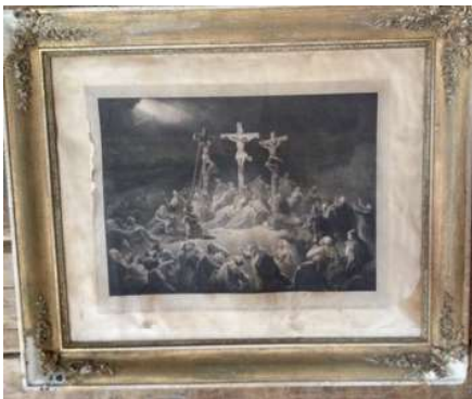
Det største bildet på veggen i huset skildrer korsfestelsesdramaet. Det finnes mange reproduksjoner av dette motivet, bl.a. litografier av N. Currier fra 1849.