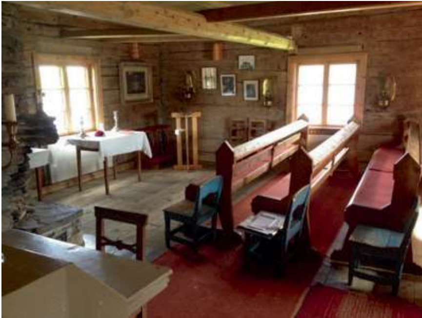
Inne i huset finnes trebenker som stammer fra den gamle kirken i Karesuando. Nå benyttes det iblant til gudstjenester og vielser.