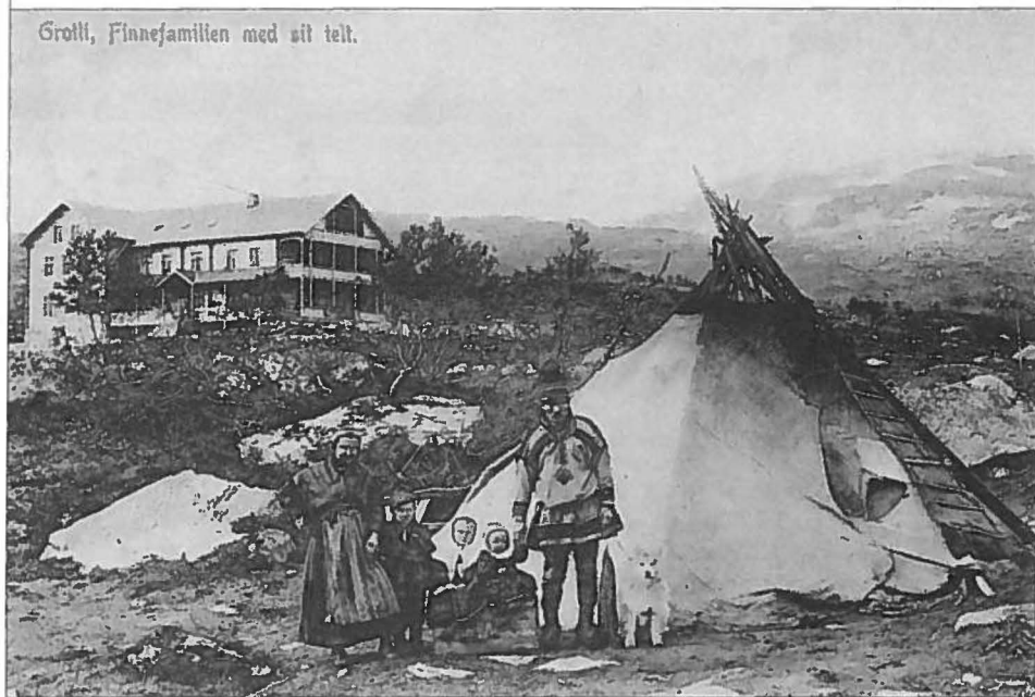
Grotli, Finnefamilien med sit telt.

«Grotli, Finnefamilien med sit telt», cirka 1905. Postkort i serie basert på bilder av Stryn-fotografen Jens Knudsen Maurseth (f. 1863). Mannen har karesuandosamisk kofte. Kanskje ble samene hentet fra Troms(ø)? Familien var nesten alltid kjern utstillinger av eksotiske folks liv og lever. Personer ukjent.