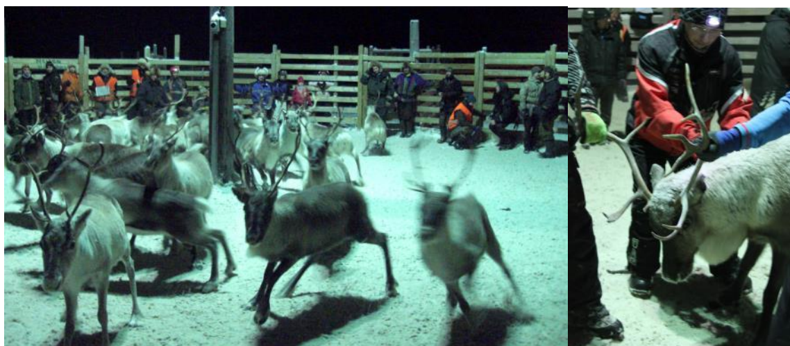
Bilde 4. Når reinen er i gjerde kan en på nært hold undersøke individer og fange opp sykdom eller skade.