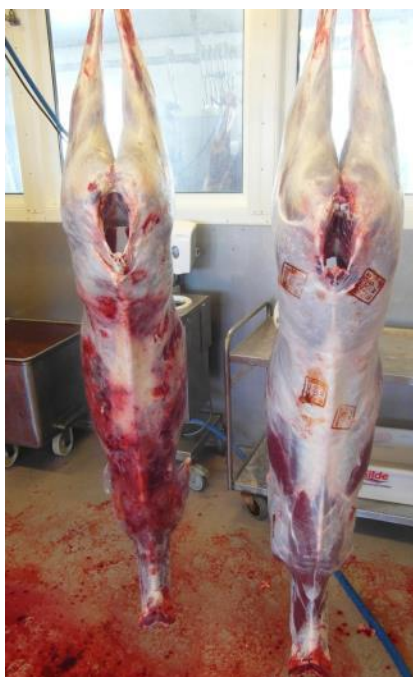
Bilde 5. Slaktet til venstre viser indre blødninger og skader, trolig påført under håndtering i gjerde eller transport, der dyret har blitt trengt eller tråkket på av andre. Normal skrott til høyre.

Hensynet til dyrevelferd gjelder inntil dyret er dødt. Etter avlivingen har metodikk og hygiene under flåing og utvomming og nedskjæring betydning for kjøttets hygieniske kvalitet. Likevel er det noen tegn på det døde dyret som forteller om hvordan dyret har hatt det. Blødninger under huden oppdages lett etter flåing. Liggende dyr (ofte eldre simler eller andre svake dyr) kan bli tråkket på under transport og kalver kan bli løpt ned i gjerde eller ved på- og avlasting (Bilde 5; Mejdell m.fl., 2014).