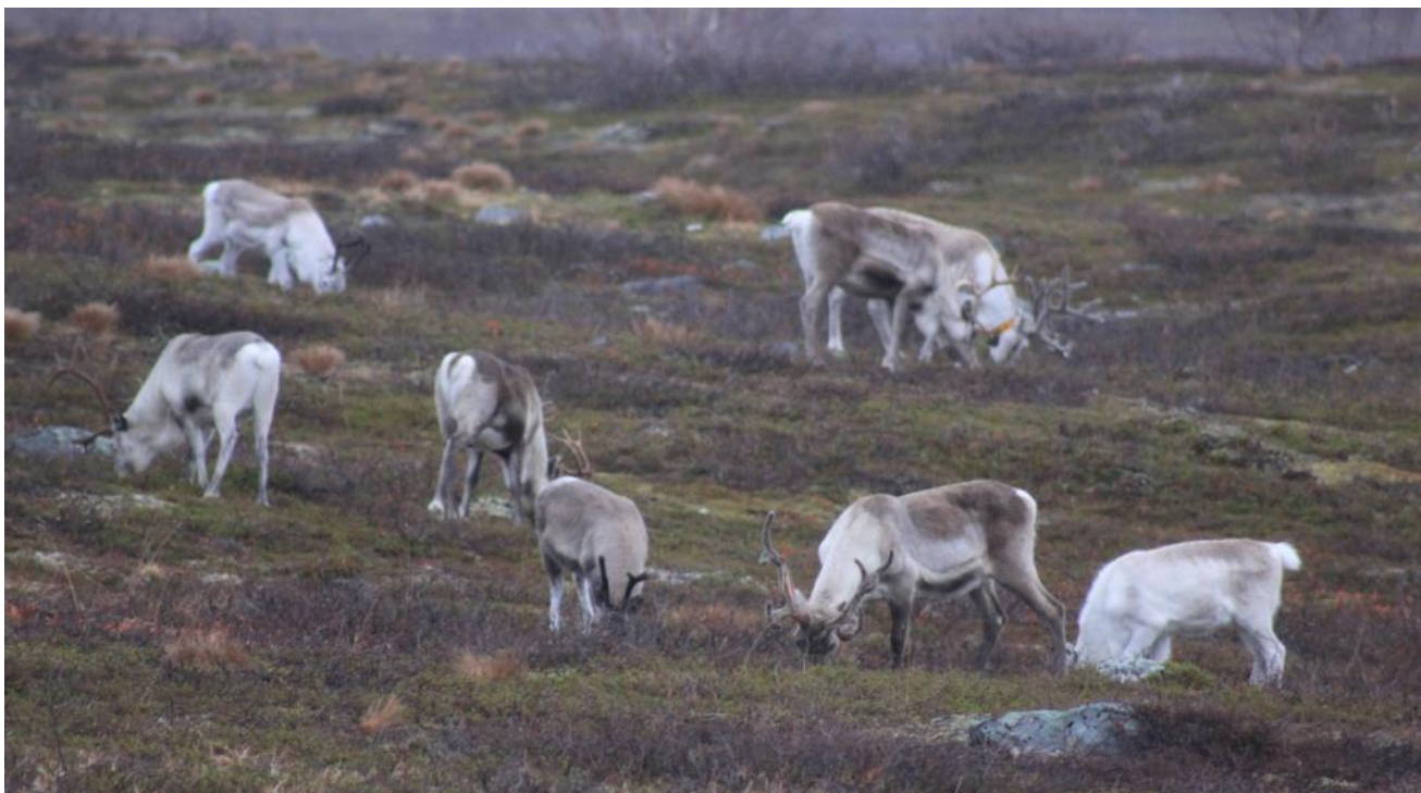
Bilde 7. Reinflokk som beiter.