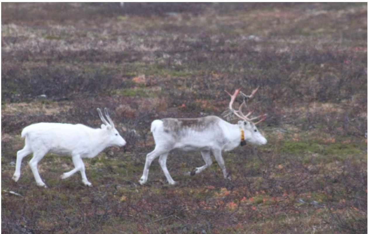
Bilde 6. Simle og kalv.