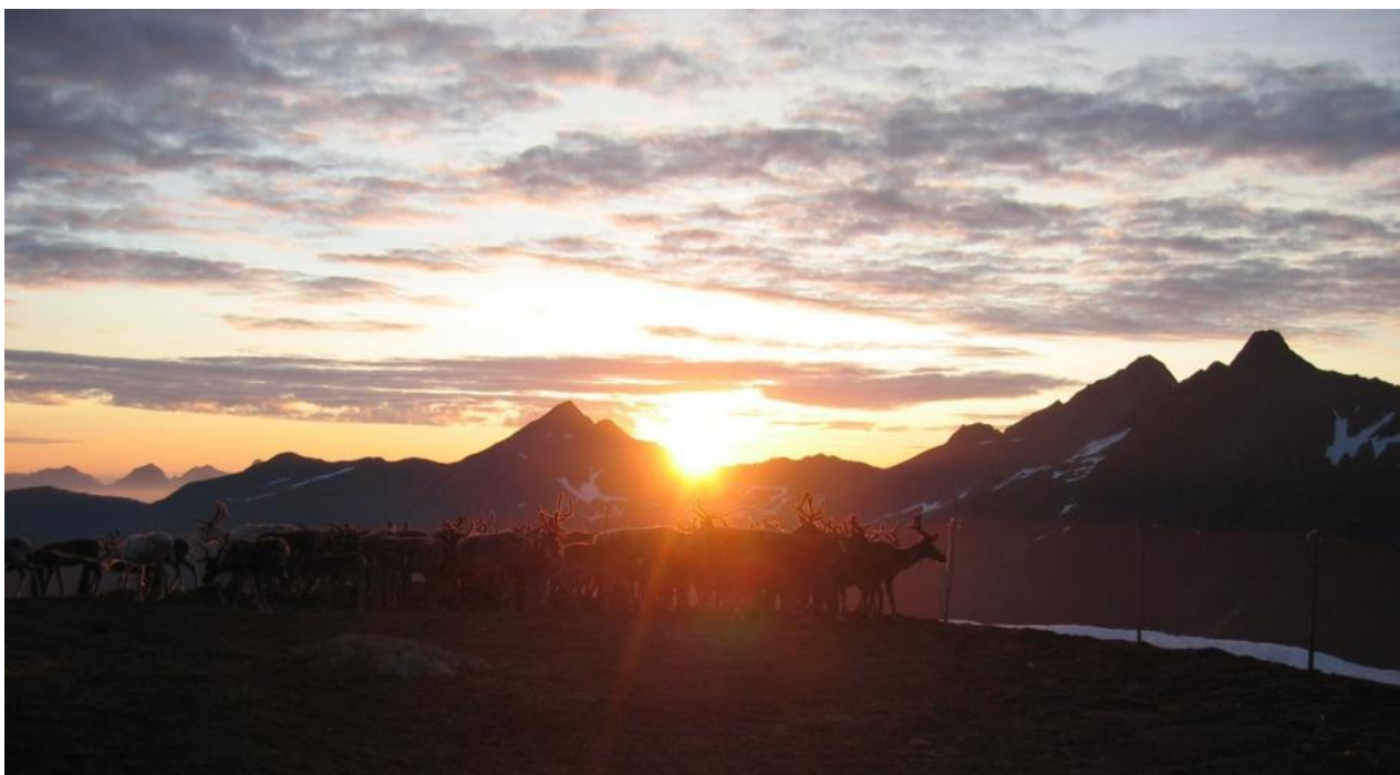
Bilde 5. Rein i solnedgang.

I neste steg kan råvaremottakerne sette krav til reineierne, slik at kjøttet som leveres på slakteriet blir av best mulig kvalitet. En oppfølging av enkle, målbare og definerte velferds-kriterier kan være reindrifsutøverens dokumentasjon på god drift. Dette kan igjen være et viktig argument for at ulike tiltak bør settes i verk fra forvaltningens side (f.eks. hvis rovdyrpresset blir for stort i kalvingsområdet). Videre kan slakteriet bruke dokumentasjonen som kriterium for god kvalitet og eksempelvis gi bedre pris for kjøtt med god lagringsevne, som dermed egner seg for å omsettes som ferskvare.