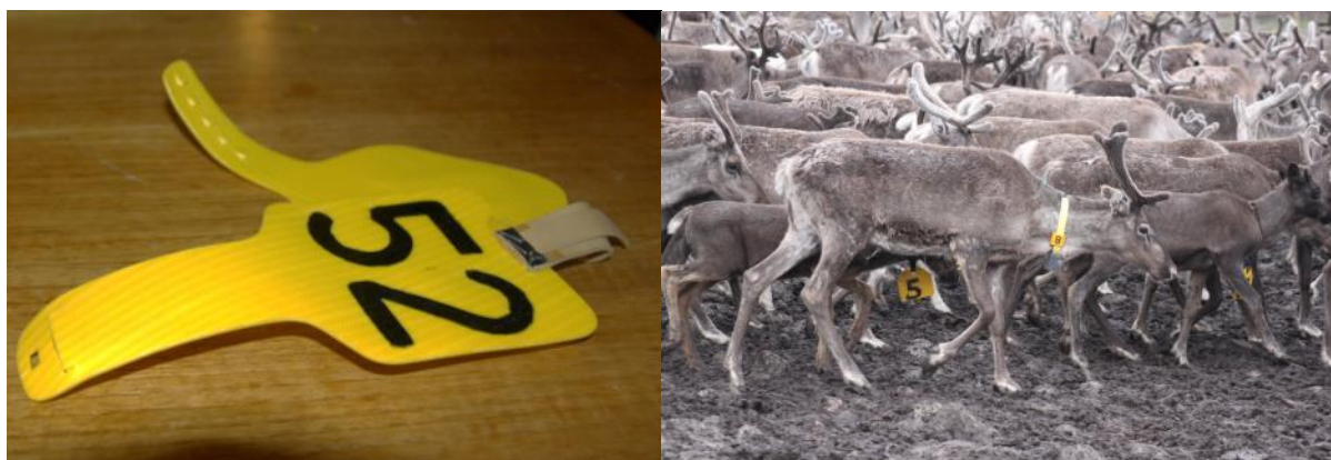
Bilde 1 og 2. En type nummerskilt som kan brukes under kalvemerking for å identifisere hvilken simle kalven følger etter og som følgelig er riktig mor til kalven.

Etter kalving starter kalvemerking. Dette foregår fra slutten av juni til midten av september (se f.eks. Bårdsen & Tveraa 2012). Dette er en prosess der matching av mor og kalv foregår i gjerde, etter at både voksne simler og kalver har fått et nummerskilt rundt halsen. Reindriftsutøverne registrerer da kalv-simle relasjoner før kalvene fanges og merkes til rett eier (bilde 1 og 2).