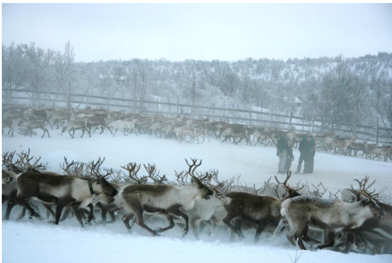
Bilde 3. Rein i samlegjerde.

Formålet med denne litteraturgjennomgangen er å identifisere ulike faktorer som kan påvirke velferd hos tamrein. Disse faktorene skulle være målbare og danne grunnlaget for velferdskriterier som reindriftsnæringen selv kan implementere i sine produksjonssystemer, på beite, i gjerdet, på slakteriet og gjennom produktmerking og fremtidige kvalitetssikringssystemer.