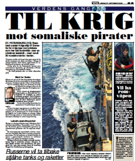
Figur 4 Avisoppslag - Til Krig

I september 2008 har VG overskriften ”Til Krig mot Somaliske pirater” (figur 4), bakgrunn var at piratene hadde kapret et skip fullastet med våpen (VG 27.09.2008:25). Bruk av begrepet krig kan assosieres med noe dramatisk, og anses som et virkemiddel staten kun bruker i ekstreme tilfeller. Når det er sagt så kan det være at begrepet er blitt vannet ut etter terror aksjonen i 2001, hvor ”War on terror”(Wikipedia) var et hyppig brukt uttrykk. Bruk av ordet krig og bildet av en militær enhet, bidrar videre til at leseren får et inntrykk av at trusselen er så alvorlig at et ekstraordinært virkemiddel er nødvendig (Williams, 2009). En slik fremstilling bidrar dermed til å konstruere et trusselbilde som skaper aksept for at et ”ekstraordinært tiltak” kan iverksettes.