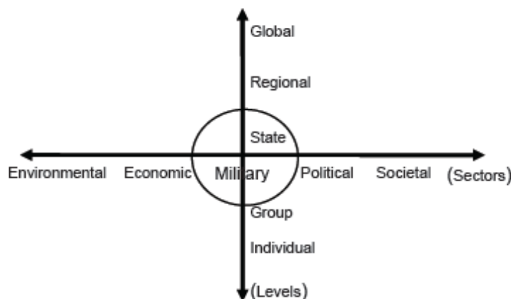
Figur 1 Utvidelsen av konseptet sikkerhet

Emma Rothschild (1995) oppsummerer utviklingen og den utvidede forståelsen av sikkerhet i to dimensjoner. Vertikalt har sikkerhet utvidet seg fra sikkerhet for nasjoner og individer i den nedre enden av skalaen, og til internasjonale systemer og biosfæren i den øvre enden. Den horisontale aksene plasser ut sektorene, fra den militære til den politiske, økonomiske, samfunn, miljø og "human security". Samtidig trekker hun fram at ansvar for sikkerhet også utvides fra nasjonalstaten oppover til internasjonale institusjoner, og nedover til regional og lokal makt. Horisontalt til "ikke statlige organisasjoner", media og velgere. Kristian Åtland gjengir en modell av Ole Wæver i sin avhandling som viser utviklingen i de to aksene. Modellen er ikke helt lik det Rothschild beskriver, men viser allikevel både utvidelsen (sektorer), og de ulike nivå analysen kan fokusere sin analyse på ( deepening ) (Åtland, 2009:15).