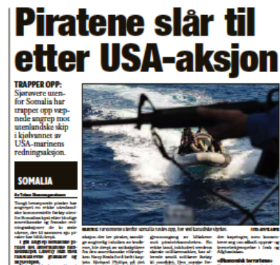
Figur 5 Avisoppslag ”Piratene slår til etter USA-aksjon

Klassekampen varsler i april 2009 at ”Piratene slår til etter USA-aksjon”, ”Sjørøvere utenfor Somalia har trappet opp væpnede angrep mot utenlandske skip i kjølvannet av