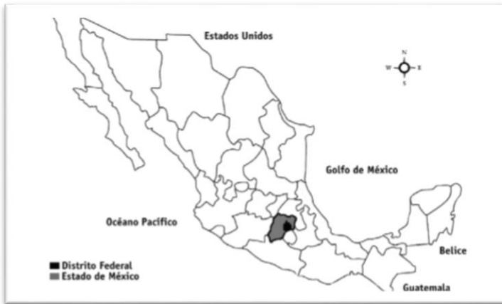
Figura 1- Ubicación de la CDMX y EDOMEX. (Morett, 2014: 801)

En lo que sigue, voy a destacar algunas de las zonas que veremos posteriormente en la encuesta como las que han tenido particular importancia para los hablantes encuestados. Debajo presento una tabla con las zonas relevantes en las que me voy a concentrar.