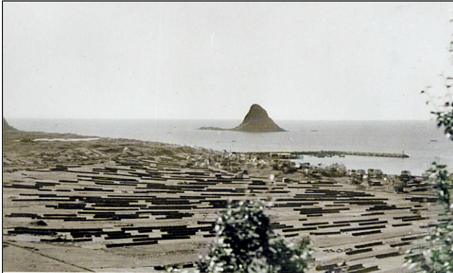
Fig.nr.2: Bleik med oppdyrkede myrområder i forkant. Hesjene står tett i tett på de ulike teigene. Bebyggelsen på gårdshaugen er nærmest sjøen. Foto: Walther Norheim, 1950-tallet

Oppe i fjellsida ligger et steingjerde, 300 m langt. Om anlegget ble brukt i jakt på villrein eller som sperregjerde for tamrein, er usikkert. Derfor er det vanskelig å tidfeste det. I fjellsida på motsatt side, på en smal fjellrygg, ligger tre bogastiller (Askeladden, lok.Id. nr.9282). Disse er også vanskelig å tidfeste. Et annet interessant funn på Bleik er en arabisk mynt fra 906-907e.Kr. som ble funnet like ved den eldste gårdshaugen. Mynten viser at folk her har hatt kontakt utover eget samfunn (Jørgensen 1983:52).