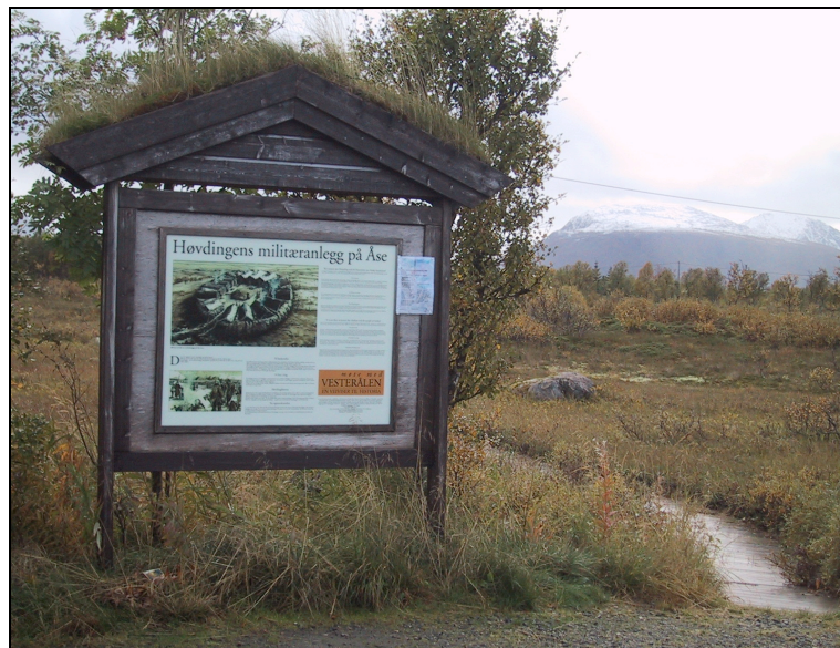
Fig. nr.4 Informasjonsskilt ved Åseanlegget Plankestien inn til anlegget sees til høyre i bildet Foto: Birgit Lund, 2005

Åseanlegget har god skilting på hovedvei i begge kjøreretningene. Det er romslig og god avkjørsel med parkeringsmuligheter og rasteplass. Et stort skilt forteller i tekst og illustrasjon om dette tunanlegget (Reklamebyrået God Strek). Fra dette skiltet på parkeringsplassen går det en smal plankesti som følger terrenget over myra inn mot midten av anlegget hvor det også står et noe ødelagt stativ for brosjyrer. Da jeg var der var kassen tom, men brosjyrer over anlegget er å få kjøpt på Andenes 4 ½ mil unna. Vegetasjonen på området er lyng, gress og bjørk. Det vokser små bjørketrær også inne på tunanlegget. På grunn av tett bjørkeskog ned på myra i nordøst, er det ikke mulig å se sjøen.