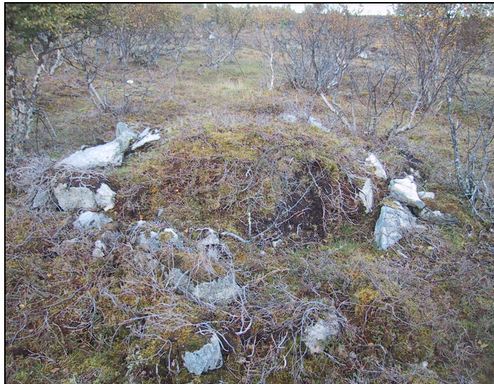
Fig. nr. 6: Gravrøys på Øygård (mulig uregistrert)

røysene pga bjørk og tett lyngvegetasjon, men de var begge store og markerte, og passet beskrivelsen, så det gikk greit. (Askeladden, lok.Id nr.37608 og 57441). To hustufter og en gravrøys (Askeladden, lok.Id nr. 8268) som skulle ligge enda lenger sørvest for området med gravrøysene, fant jeg ikke. Men i stedet fant jeg en steinrøys eller mulig gravrøys som jeg ikke har funnet noen dokumentasjon på! Denne røysen mener jeg ikke kan være den jeg lette etter, altså den minste av de fire gravrøysene som skulle ligge på samme område. Denne ligger lenger vest og er dessuten noe større. Den ligger 25m NØ for lokalitet nr.37608, men på motsatt side av det gamle skillegjerdet. Gravrøysen er ca 4-5m i diameter og ca 1 m høy. Kantene rundt er noe uryddig på to av sidene. Min tolkning av steinene, er at de danner fotkjede i det jeg tolker som gravrøys. Den har ikke krater i midten, så det skulle antyde at den ikke er åpnet. Røysen er godt markert. Vegetasjonen omkring er lyng og bjørk.