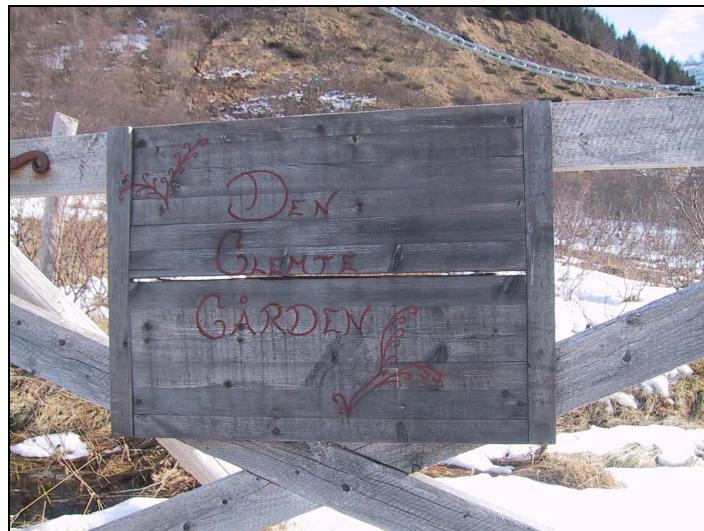
Fig. nr.3: Skilt på grinda inn til Bakkan/Sletten

Stedet er merket ”Jernaldergård” ved hovedveien hvor det også er parkeringsplass med rasteplass. Derfra går en utmarksvei langs fjellsida. Der veien slutter, er en inne i fornminneområdet som tidlig ble regnet som så betydningsfullt at det allerede i 1967 kom på nasjonal liste over høyt prioriterte fornminner (Hagen m.fl. 1967:88). Ødegården Bakkan har fortsatt bevart sitt særpreg fordi det har fått ligge ganske uberørt oppunder fjellfoten helt siden boplassen ble lagt øde en gang i middelalderen. Det at stedet har vært tilbaketrasket fra matrikkelgården Bø og har beliggenheten på en morene, har nok også medvirket til bevaring. Og som brosjyren forteller, har ikke stedet egnet seg til moderne jordbruk, men området har vært brukt til beiteland, slåtteland og potetland inn i vår tid (Bjerck:6).