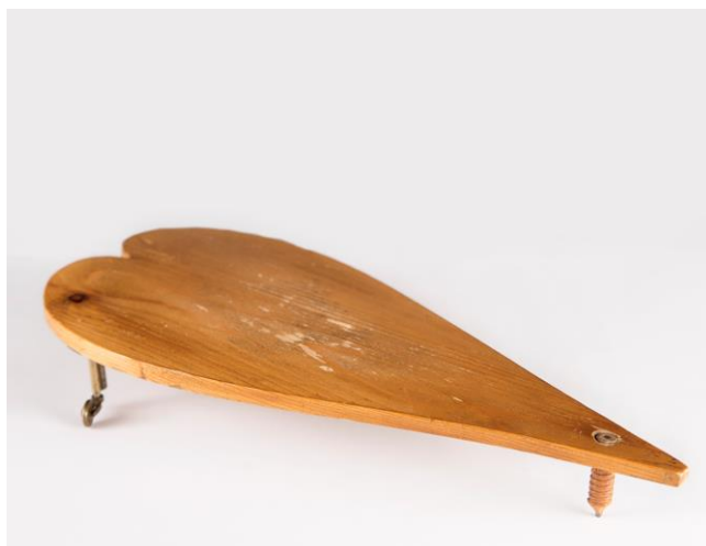
Figur 3: Psykograf: Helsingborgs museers samlinger, Sverige