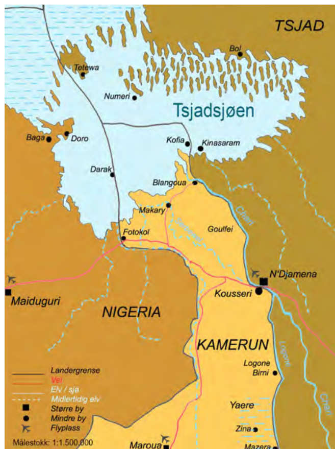
Kart over den sørlige delen av Tsjadsjøbassenget.