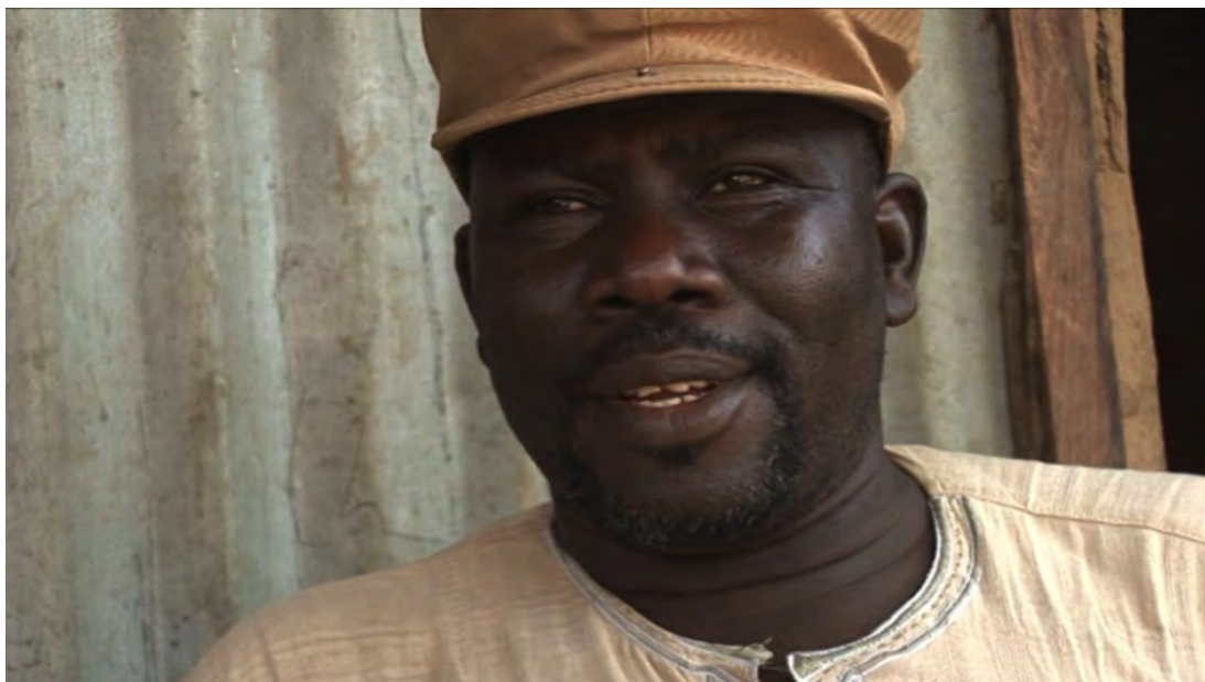
Klipp 2, sekvens 10: På kontoret som Kahaye har etablert ved sjøen.