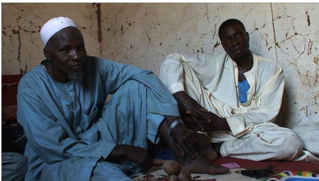
Klipp 3, sekvens 5: Gruppeintervju med lokale fiskere.