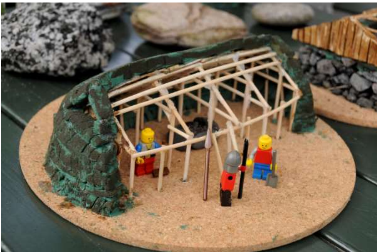
Rekonstruksjonsforslag for årestue, typisk for Sør-Troms og nordre Nordland i høgmellomalderen. Forslaget er utarbeidd av forfatteren på basis av observasjoner fra boplasshaugene Saurbekken, Trondenes, Stauran og Soløy. Husets lengde er ca. 10m.