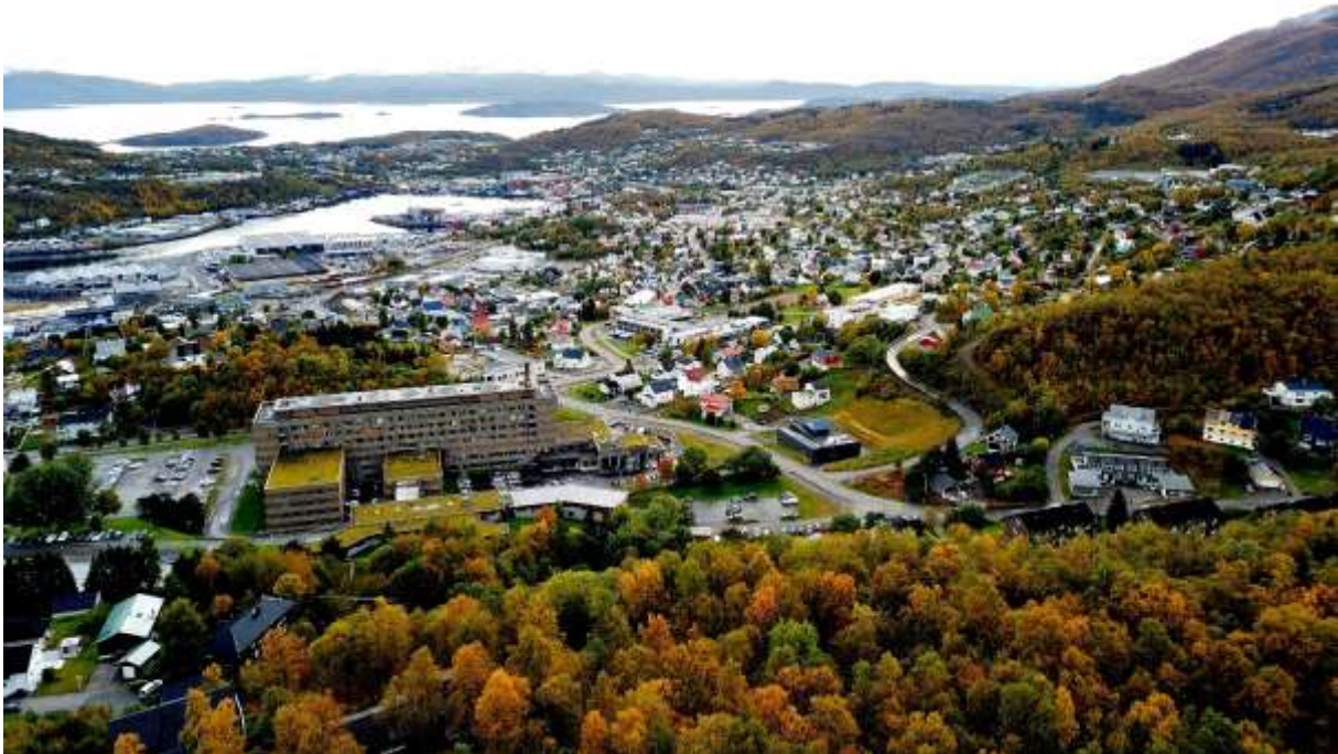
Foto over søndre bydel, tatt fra Harstadåsen. Heggen videregående skole ligger omtrent i bildets sentrum og Saurbekken ligger på det grønne feltet litt til høyre for skolebygninga. Sjøveien til naustet må ha gått ned til Seljestadbukta. Harstadgården, nærmeste nabo, ligger like utenfor venstre bildekant.