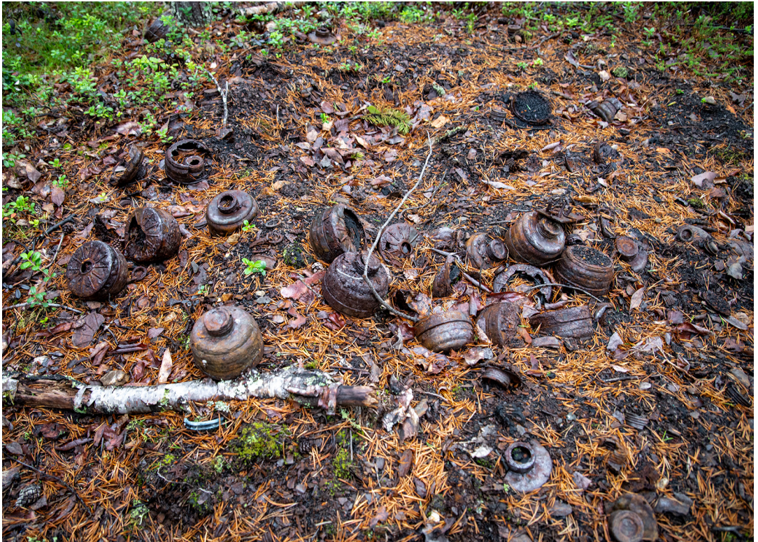
Figur 5. En stor konsentrasjon med både "fysisk" løse og jordfaste gjenstander, i dette tilfellet tyske gassmaskefilter, i en av brakkene i Luftwaffe-leiren ved Gjøkåsen. Rester etter tyskernes systematiske ødelegging av deres eget krigsmateriale under tilbaketrekningen fra Finnmark.

skal tolkes. Som vi har sett i gjennomgangen av relevante lovverk, forarbeid og kommentarer som eksplisitt diskuterer denne distinksjonen, ligger det en konsensus i at skillet mellom fast og løst ikke hovedsakelig handler om kulturminnene er "fysisk fast" i undergrunnen, men heller hvordan tingene ligger i forhold til en romlig definert lokalitet og derfor kontekst og helhet .