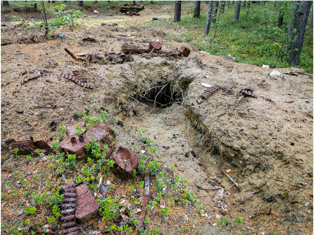
Figur 4. Spor etter metallsøk og graving etter gjenstander i Luftwaffe-leiren.