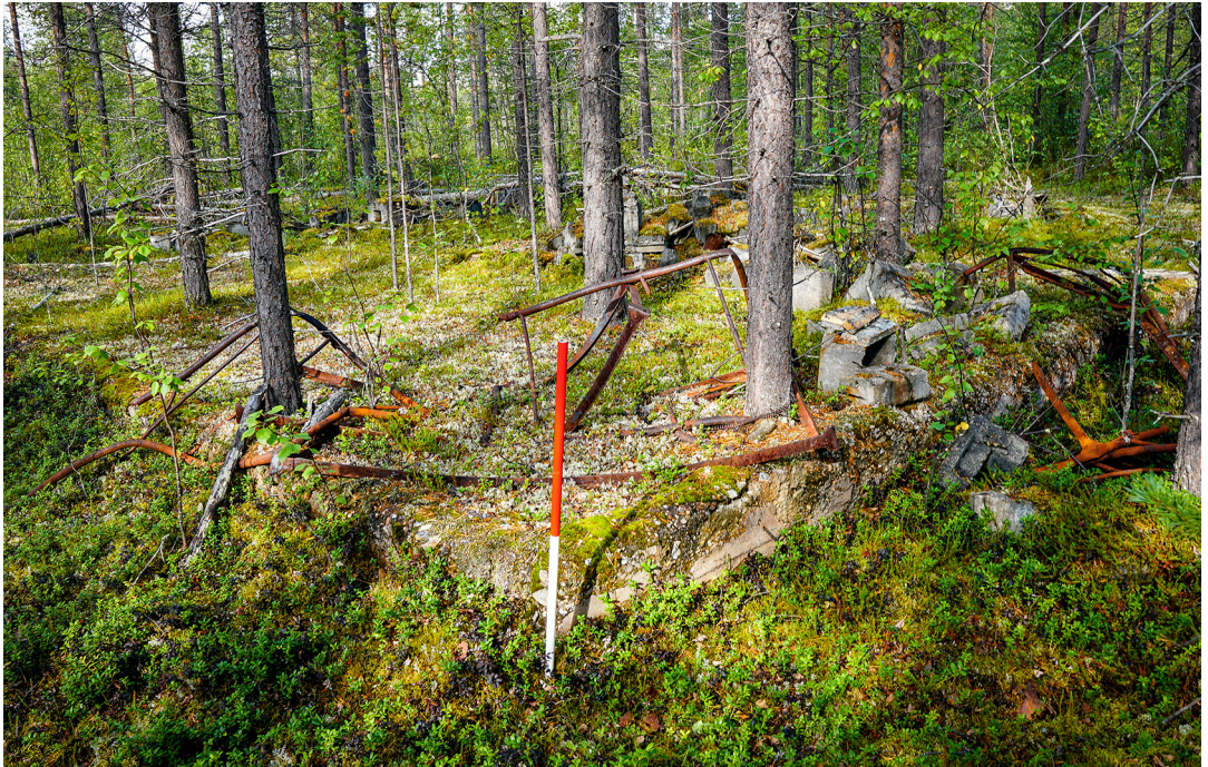
Figur 8. Furutrær vokser seg store på brakkefundamentene i Luftwaffe-leiren på grunn av god drenering sammenlignet med den omkringliggende myra. I dette tilfellet har flere furutrær vokst sammen og igjennom tyske sengerammer i en mannskapsbrakke.

rammer, til forskjell fra kulturminneloven som har en grunnleggende statisk forståelse av kulturminner, åpnes det opp for en forvaltning som tar hensyn til et landskap hvor ting har egne livsløp (se Figenschau 2016:212-213; Farstadvoll 2019:83-85). Vern er altså ikke alltid synonymt med statisk bevaring.