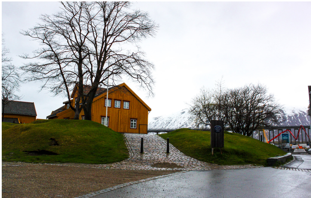
Figur 1. Komplekst fredet kulturmiljø i Tromsø: Tromsøbrua er forskriffsredet (Askeladden-ID 110551-1), forsvarsverket Skansen er automatisk fredet (ID 63222-1), mens den gamle Tollboden (ID 87577-1) og Bårstua er vedtaksfredet (ID 87577-2).

innebærer en oppfyllelse av alderskriteriene at de er automatisk fredet jfr. §4. Løse kulturminner omtales i § 12a-c. For løse kulturminner brukes ikke begrepet (automatisk) fredet, men av § 13 fremkommer det at løse kulturminner like fullt ikke må skades. Vernet av løse kulturminner ivaretas gjennom at de ansees som statens eiendom om det "[...] ikke lenger er rimelig mulighet for å finne ut om det er noen eier eller hvem som er eier" (jf. § 12 første ledd).