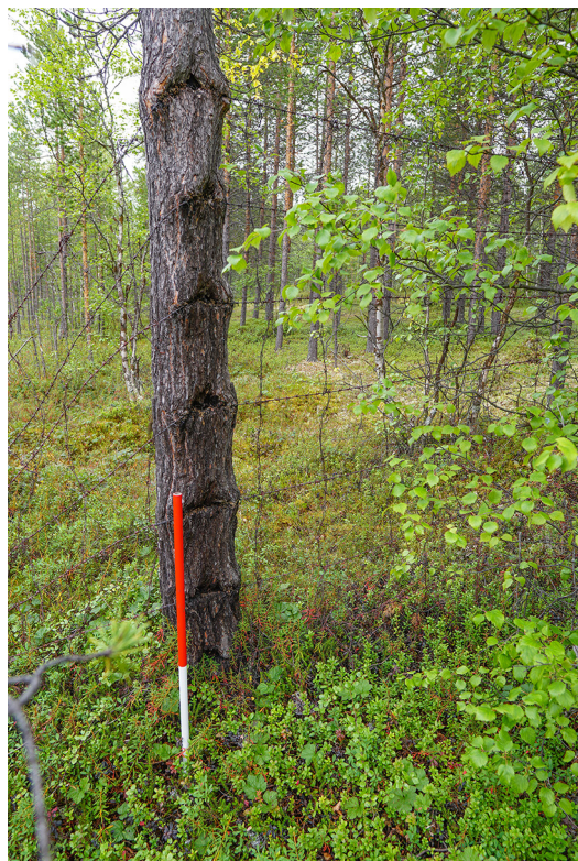
Figur 7. Gjerdet som en gang markerte grense til Luftwaffe-leiren er for det meste borte, men enkelte korte seksjoner er fortsatt bevart. Her ser vi et eksempel på en konkret sammenblanding av natur og kultur hvor levende furutrær er brukt som stolper til å feste piggråd. Tafonomisk sett vil trærne bære spor av gjerdet lenge etter at piggråden har rustet vekk, og fordi de er levende vil de naturlig nok vare mye lengre enn det "døde" trestolper ville ha gjort.

I en slik forståelse av vern, som inkluderer endring og naturlig utvikling innenfor visse