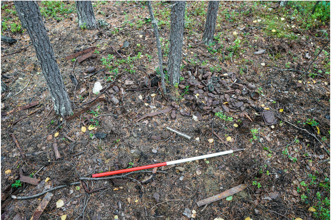
Figur 6. Løse gjenstander på overflaten til brakka. Mange av gjenstandene har blitt løsgjort fra jordsmonnet på grunn av graving i tuffen i nyere tid. Gjenstandene har delvis mistet sin opprinnelige kontekst og plassering i undergrunnen, men de ligger fortsatt i en klar og meningsbærende sammenheng med brakken som en helhet.

Krigsminnene ved Luftwaffe-leiren er en viktig del av et større krigslandskap fra andre verdenskrig som dekker Øvre Pasvik landskapsvernområdet. Både kvantitativt og kvalitativt er krigsminnene en substansiell del av landskapsvernområdet. I tillegg til krigsminnene ved Gjøkåsen, finnes det flere store lokaliteter fra andre verdenskrig ved Nyrud, Tangenfjellet, Tangenfossmoen og Grenseformoen lengre sør i Øvre Pasvik landskapsvernområde.