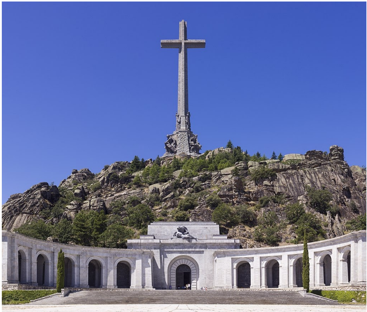
Framsida og inngangen til den underjordiske kyrkja

mørk stein. Under steinkrossen, inne i fjellet, er det bygd ei kyrkje. Den er sprengt inn i fjellet og måler 260 meter i lengde, noko som gjer den større en Peterskyrkja i Vatikanet. Den er utan vindauger og sparsomt opplyst, slik at den får ei dyster framtoning. Den blei utnevnt til basilika av pave Johannes den 23. likt med opninga av monumentet. 8 Kyrkja, krossen og eit benediktinerkloster som ligg bak fjellet er knytt saman med underjordiske heisar og gangar. Klosteret er også eit storslege byggverk som er oppført i same type granitt som krossen. Den har ei rektangulær utforming i nyklassisistisk stil med ein stor åpen plass i midten, og måler 150 ganger 300 meter. Klosterområdet inneheld utanom boligkvarter og eiga gravplass for munkane, ein restaurant, skule og overnatting for besøkande. 9