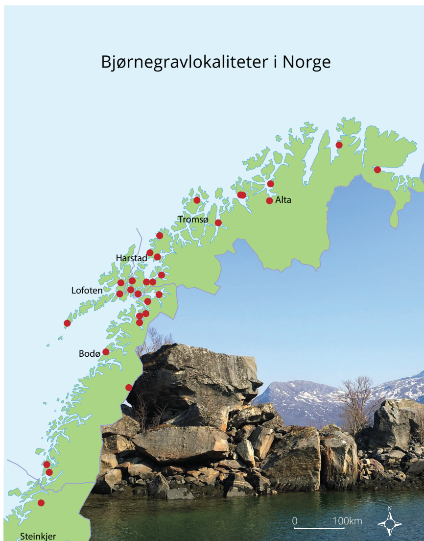
Figur 1. Utbredelse av bjørnegraver i Norge. Et typisk landskapstrekk ved gravene langs kysten er at bjørnebeinene ligger under store steinblokker. Bjørnegrav i Nevelsfjord i Bodø kommune datert til 11-1200 tallet. Grafikk: Grafiske tjenester, Norges arktiske universitet UiT.

tradisjonene og de rituelle handlingene. De tidligste kildene finner vi i de mange misjonsberetningene fra 1600 og 1700-tallet (Niurenius 1645; Rheen 1671; Schefferus 1673; Dass 1739; Fjellström 1755; Leem 1767; Friis 1871). Utover