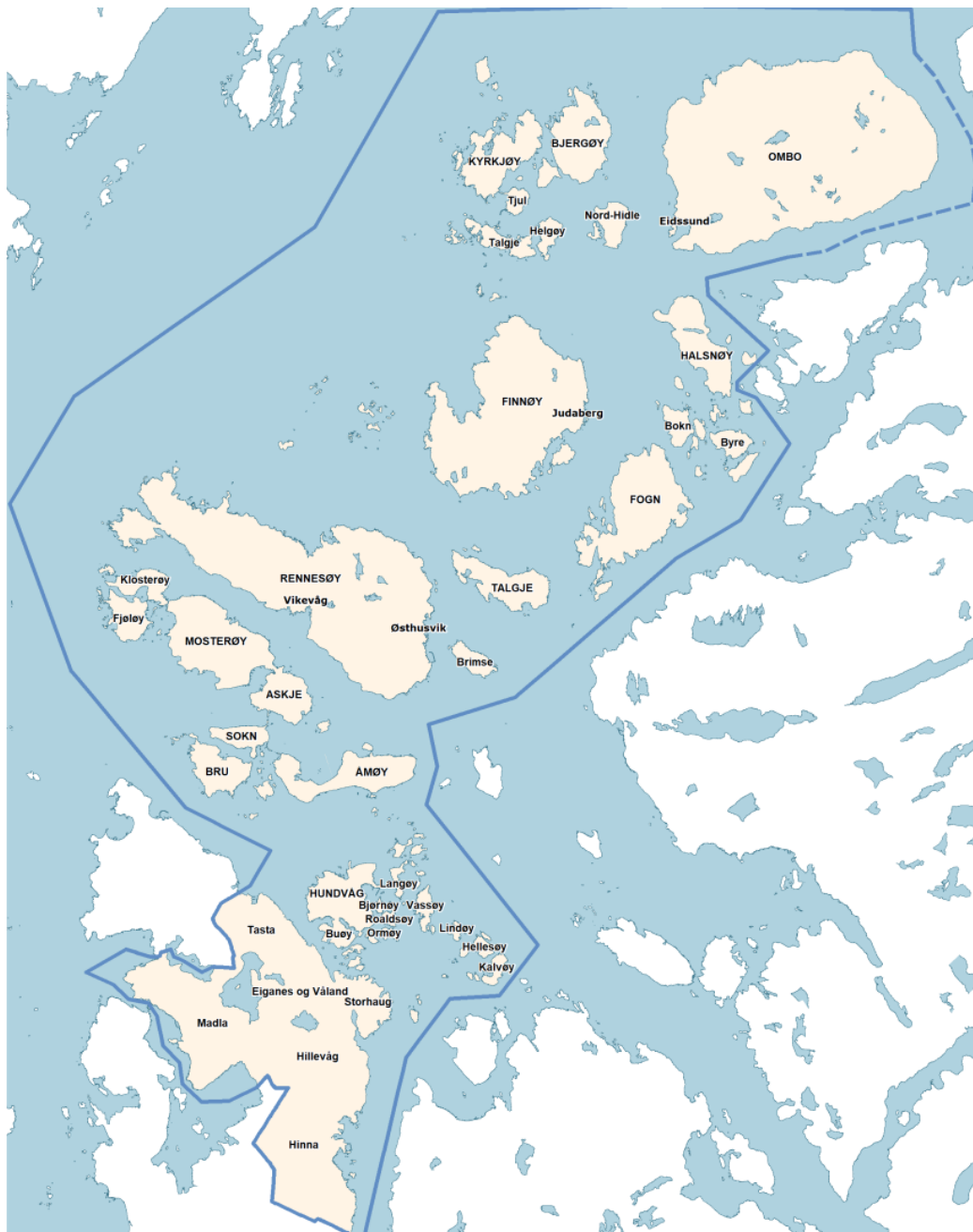
Bilde 2. Kart over nye Stavanger kommune. (Stavanger kommune, 2019a)

1. januar 2020 blei kommunane Stavanger, Finnøy og Rennesøy slått saman til ein kommune. Stavanger kommune ligg i Rogaland og er Noregs fjerde største kommune. Kommunen har eit landareal på om lag 241 km 2 og det er ca. 142 000 innbyggjarar fordelt på fastland og 37 øyar. I nye Stavanger kommunen er det store variasjonar. Det er både ein bykommune med relativt komprimert busetnad samt ein kommune med store land- og havareal der busetnadsmønsteret er meir spreidd. (Stavanger kommune, 2019a) Stavanger er eit langstrakt by- og øysamfunn, med ei kompakt bykjerne. (Stavanger kommune, 2020, s. 4)