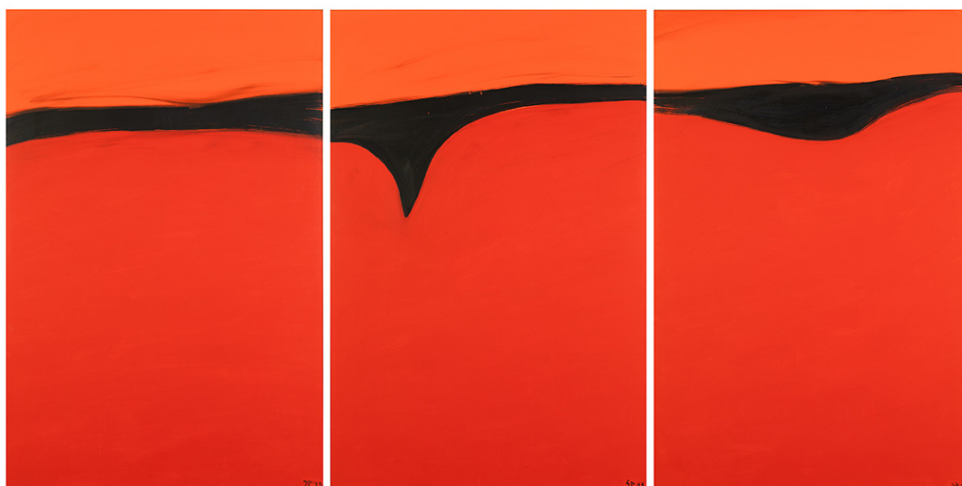
III. 3 Synnøve Persen: Roaddi I, II, III / Røde landskap I, II, III , 1993. Olje på lerret, hvert 150 x 100 cm. Nr. 1 i serien eies av Troms fylkeskommune; nr. II og II av Sámiid Vuorká-Dávvirat, Kárášjohka. © Synnøve Persen / BONO 2022.

Utsagnet viser både til den sanselige erfaringen i opplevelsen av landskapet og malerens fysiske bearbeidelse på lerretet, naturopplevelse og abstraksjonsprosesser ser ut til å være i berøring med hverandre på et mentalt plan. Maleriene viser et frapperende samvirke mellom asymmetriske former, subtile koloristiske nyanser, dekorativ eleganse i de buede grensefeltene og en samlet kompositorisk virkning. Samtidig påkalles et tidsaspekt der forventninger om og erindringer av landskap, kroppslige, så vel som mentale og kognitive prosesser, også er med.