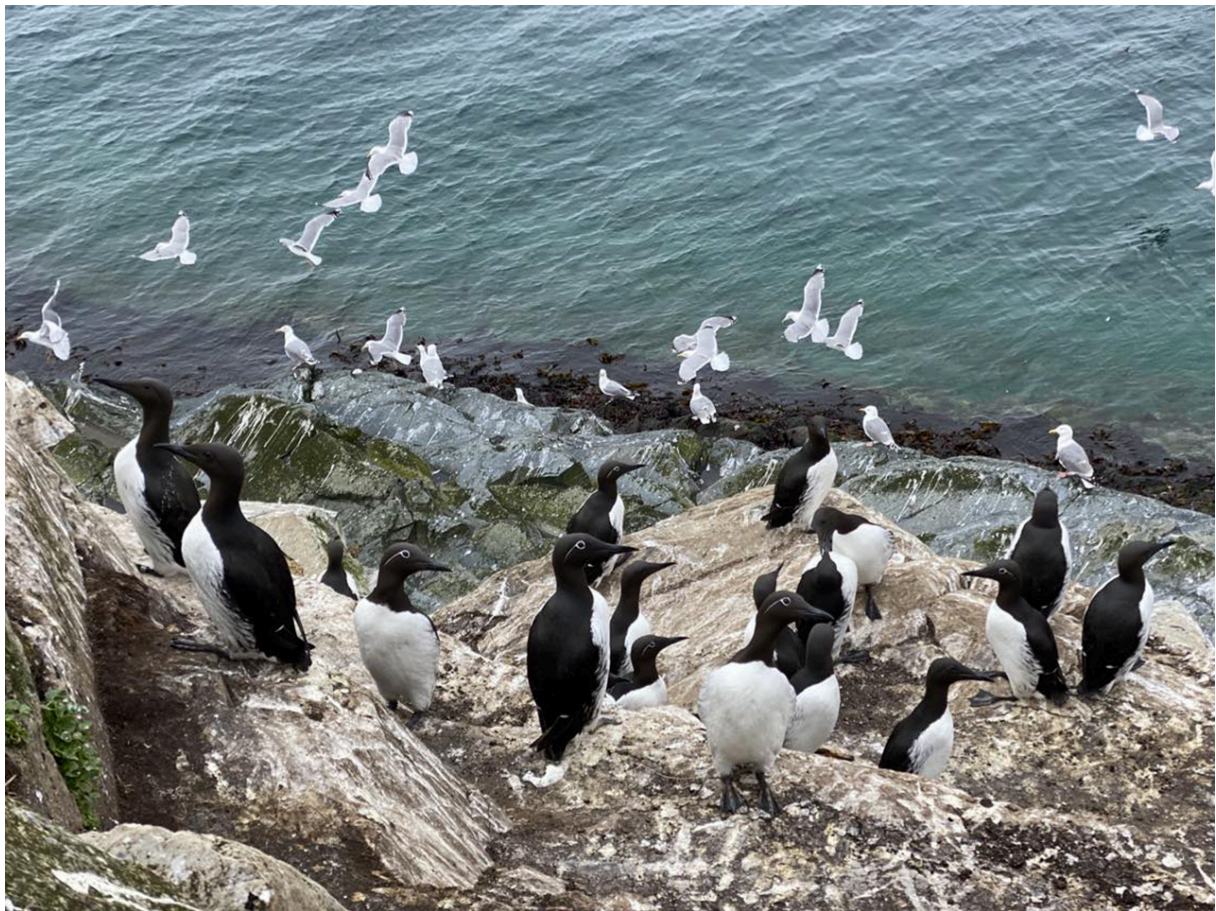
→ Figur 5: På Hornøya kommer en tett på fugl.

Fortellerverkstedet bød på beretninger også fra nåtida om uredde sjøfugler som tilpasser seg mennesket og det menneskeprega miljøet: «Nå i sommer kjørte det ut over 3000 turister til Hornøya. Du trør jo på skarven, han flytter seg ikke». Dette fikk vi også oppleve på vår tur til Hornøya. Vi gikk tett på både toppskarv, lomvi og krykkjer, som ikke så ut til å bli skremt av vår tilstedeværelse. En “bevinget” historie som sirkulerer i Vardø i dag er den om krykkjene som blir liggende på hekkeplassene i fenderdekkene på Dampskipskaia i Vardø til og med når Hurtigruten legger skipssida inntil – også der imponerer krykkja med tilpasningsdyktigheten sin til menneskemiljøet.