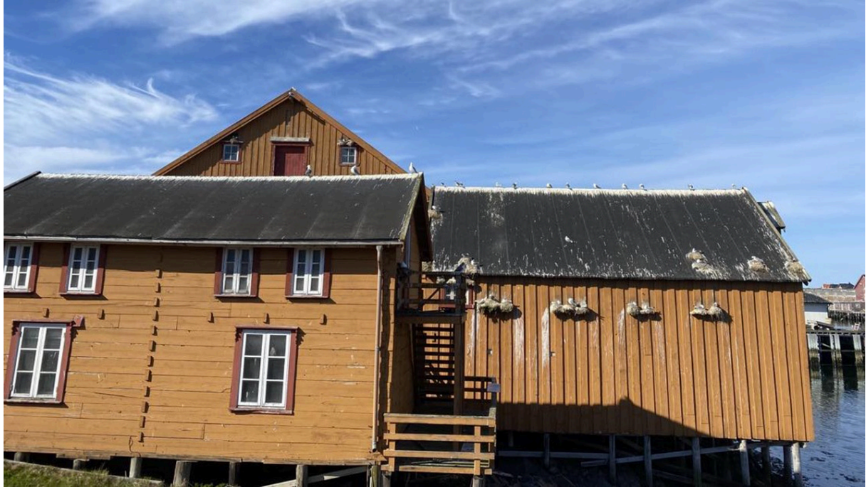
→ Figur 6: Hekkende krykkjer preger fasaden på Pomormuseet.

som kommer for å se på fugleliv i fuglefjellene, blir fascinert også av krykkjene i byen. Et yndet fotoobjekt er veggene på Pomormuseet, som er dekt av hekkende krykkjer. Slike turistiske prosesser er med å ytterligere skrive krykkja kulturelt inn i byen.