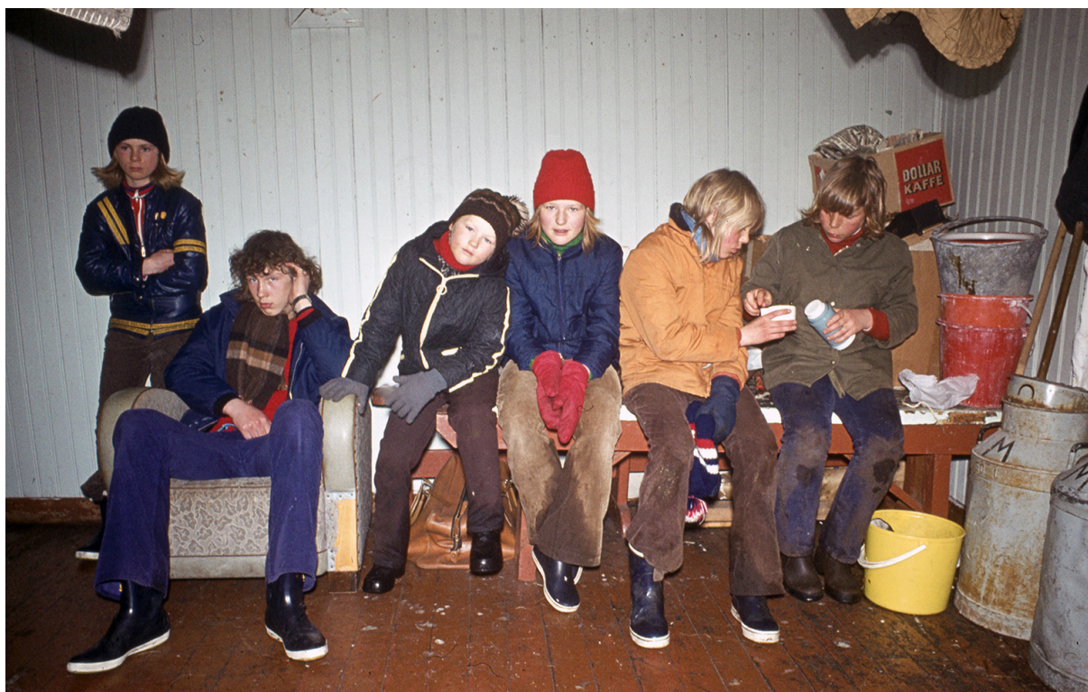
→ Figur 3. Slitne ungdommer etter en lang dag med eggplukking.