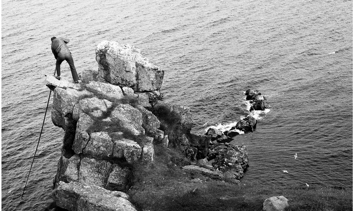
→ Figur 4: “Det var mye spenning med å klatre i stauran”. Fra Ekkerøy.

å kunne ta imot. Det var heller ikke fritt for at folk skadet seg. Ferdsel i fuglefjellene kunne også være fatalt – en av de eldre mente at det gjennom tidene har vært flere dødsulykker i Syltefjorden. Det samme formidles i beretninger fra Sjøfuglarkivet ved Tromsø museum.