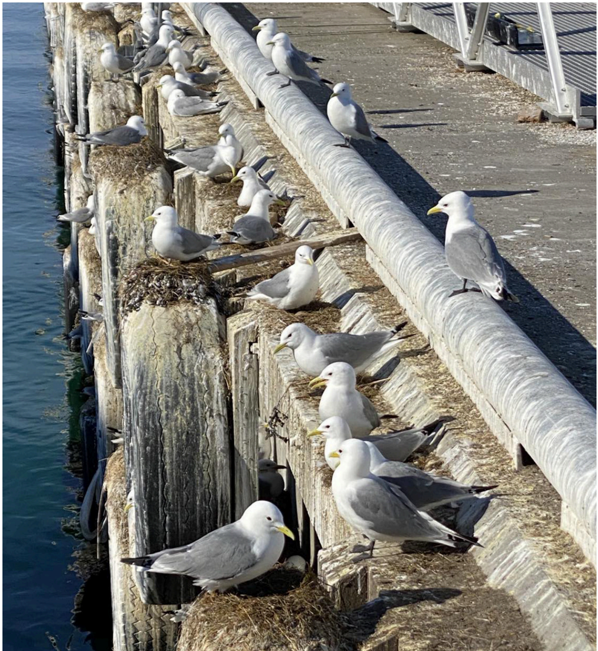
→ Figur 1: Kaiene i Vardø er blitt urbane fuglefjell.

brygger var det satt opp kasser for krykkja, hvor reirene lå tett i tett. Sjøfuglforsker Tone Reiertsen guidet oss på vandringen og fortalte om en dramatisk nedgang i krykkjebestanden på 75% siden 1999. Hun forklarte hvordan nedgangen henger sammen med komplekse endringer i havtemperatur og bestanden av lodde og predatorer. Krykkja kommer til byen for å søke beskyttelse fra mennesker.