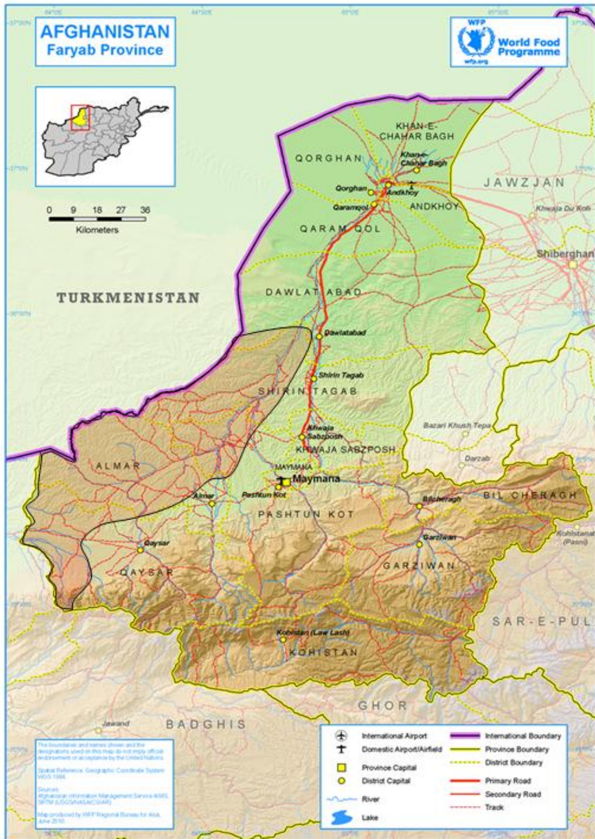
Kartet viser Faryab provins nord i Afghanistan. Markert rødt overlegg markerer det pashtunske beltet.