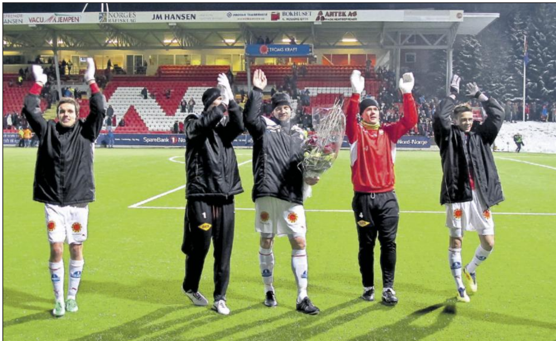
HJEMMESEIER: TIL-spillerne takker publikum etter å ha slått Rosenborg på Alfheim i siste hjemmekamp.

■ Ingen sanket flere hjemmepoeng enn TIL denne sesongen. Alfheim fungerer altså sportslig. At Alfheim er billig i drift i forhold til en ny stadion, er dessuten bra for klubbens skakkjorte økonomi.