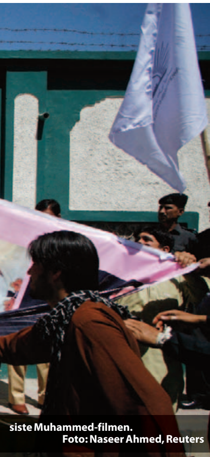
siste Muhammed-filmen.

Økonomistyringen i fotballklubber baseres ikke på fornuft, men på følelser. Få bryr seg så lenge onklene betaler. Den ene onklen i Tromsø, Troms Kraft, er blakk nå. TIL, fotballforbundet og de gjenværende onklene fortsetter å sminke tallene, men de bedrar bare seg selv.