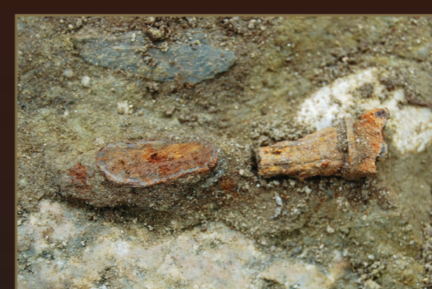
Et jernfunn med usikker tolkning funnet midt i gravkammeret.