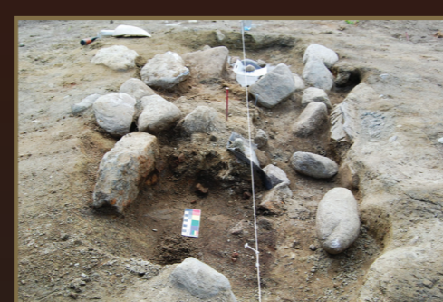
Her er barnegrava under utgravning, kammerets avgrensning vises tydelig. Ved skalaen i bildet ses en av flere nagler som ble funnet.