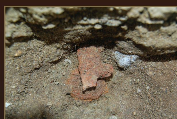
Et sterkt korrodert jernfunn fra grava, disse var det mange av. Kanskje kan dette være ei spenne?