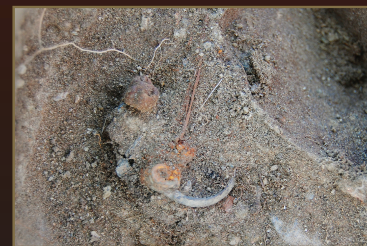
En godt bevart jeksell samt flere tannfragmenter lå like over bøylespenna. Jekselen er en andre molar nede i kjeven (frambrudd 24-33 mnd, felling 11-13 år). Jekselen viser ingen tegn til slitasje, noe som indikerer at jenta ble gravlagt kort tid etter tannas frambrudd.