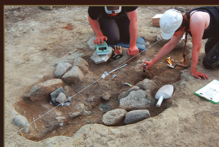
Fotomosaikk av barnegraven som viser funndistribusjonen. De røde feltene markerer hvor preparatene ble tatt ut.

I nordnorsk sammenheng peker Bø i Vesterålen seg klart ut som området med størst konsentrasjon av denne typen bøylespenner. Faktisk er det bare her at man fra tidligere har funnet helt like spenner, og de er i all hovedsak funnet i gravkontekst. Bø ligger omlag 70 km unna Kveøya i luftlinje. Barnegrava fra Hundstad viser at det har vært nær kontakt mellom de to områdene i eldre jernalder.