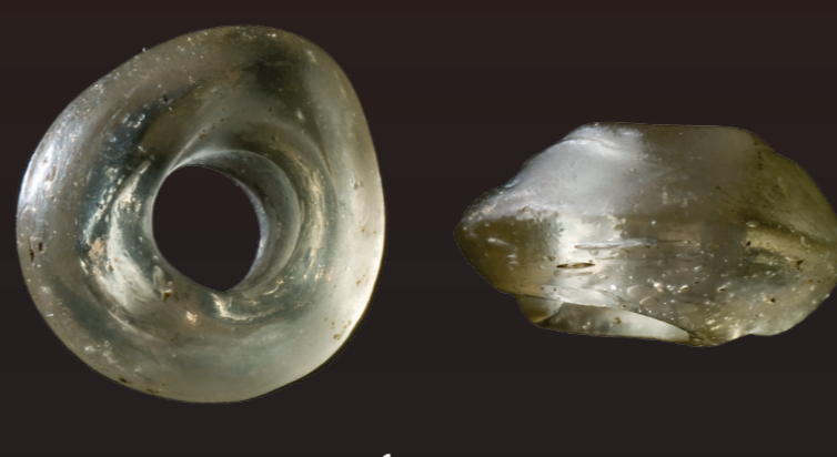
Inni kammeret, nær bøylespenna, ble det funnet ei lita lys grønn diskosformet glassperle. Perla har en diameter på 9 mm og et lengdesnitt på 4 mm.