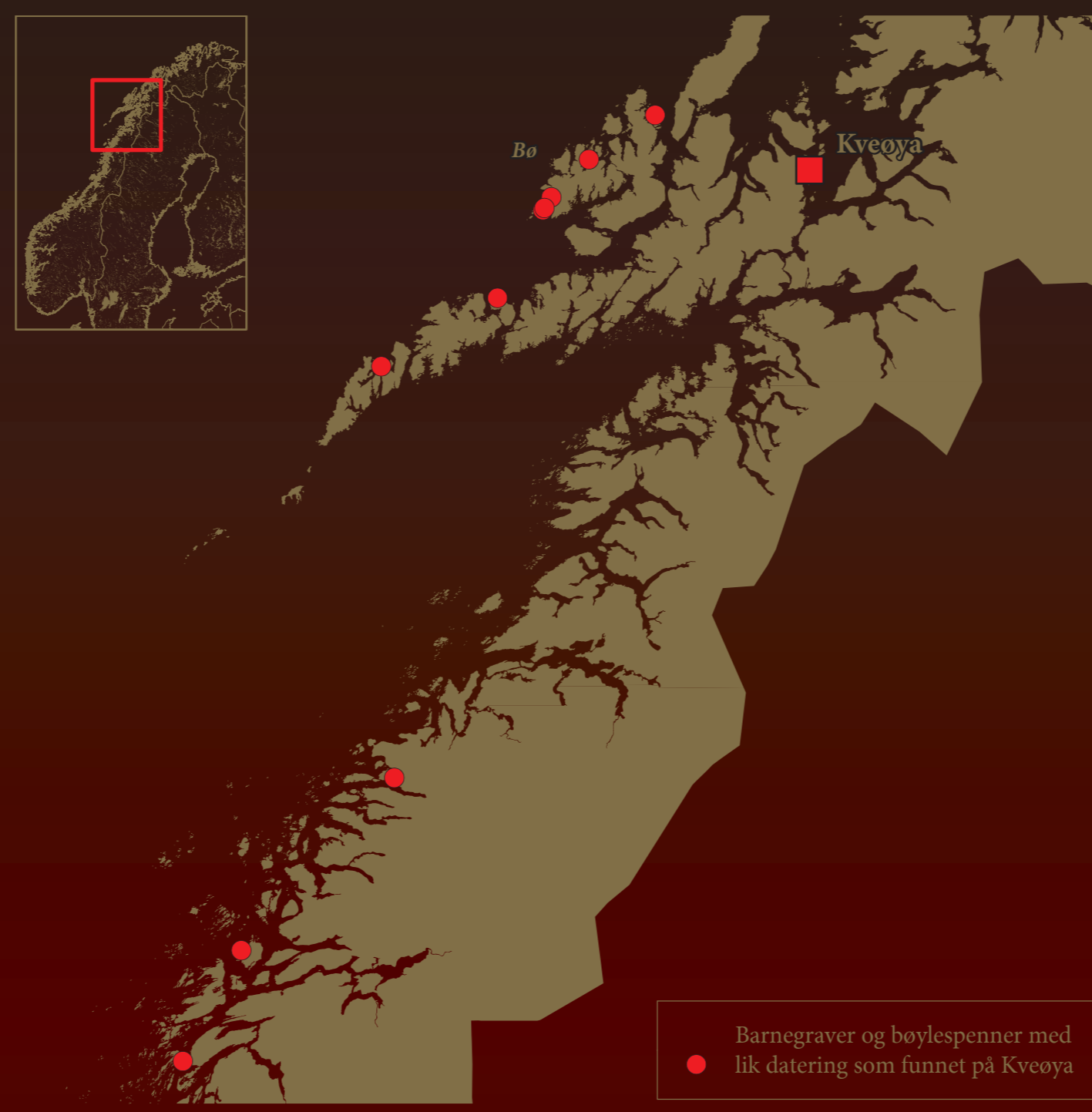
Distribusjonskart som viser Sør-Troms og Nordland fylke med funnsteder for barnegraver og bøylespenner av samme type som har blitt funnet på Kveøya innmerket.

Fra tidligere er det kjent tre barnegraver fra eldre jernalder i Nord-Norge, og alle er fra Nordland fylke. To av disse ble funnet innenfor et større gravfelt på Føre i Bø i Vesterålen, mens