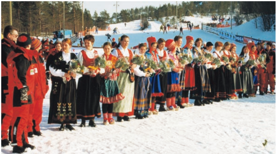
Det var stil og farge over blomsteroverrekkelsen til vinnerne under ski-NM i Kaiskuru 1998.