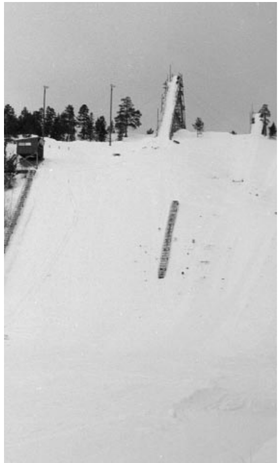
Altabakken med trestillas, slik den var før utbyggingen på slutten av 1980-tallet. I 1954 var det bare det ene stillaset. Først mange år senere ble «Mellombakken» (til høyre) anlagt. Dessuten hadde man et mindre hopp enda lenger til høyre.

Den store begivenheten under Altarennet i 1954 var innvielsen av den nye Altabakken på Aronnes. Men, som så mange ganger senere, blåste det ganske friskt over Sandfallet, og