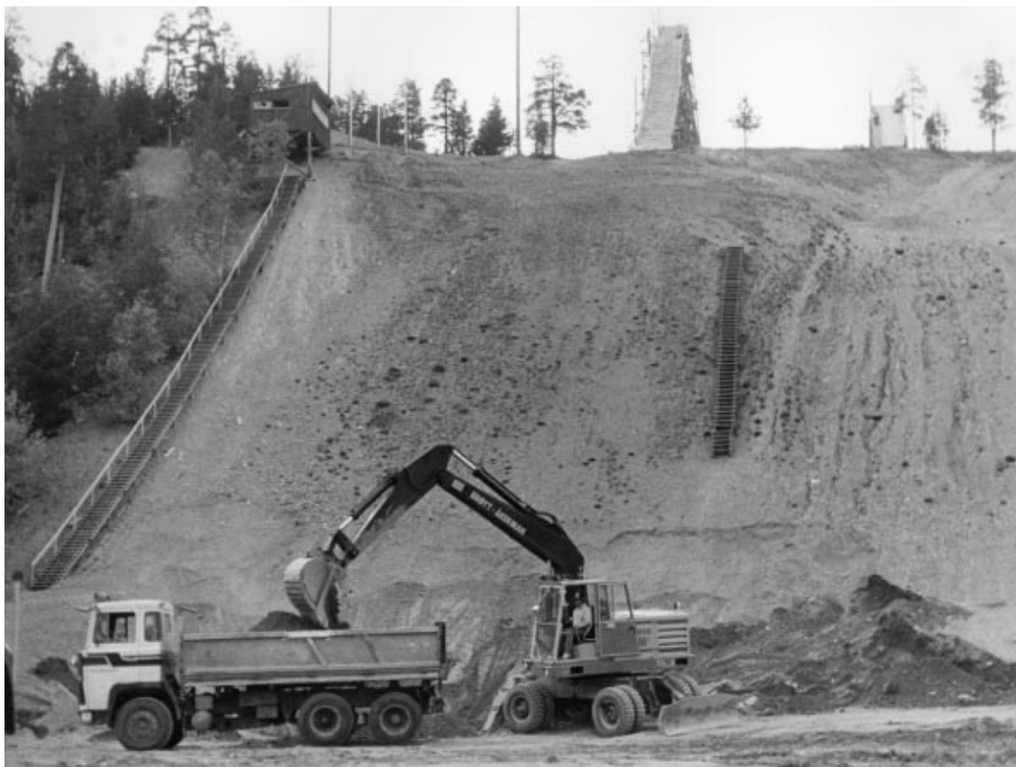
Arbeidet med å bygge ut Altabakken og gi den en ny profil til junior-NM i 1990 er påbegynt.