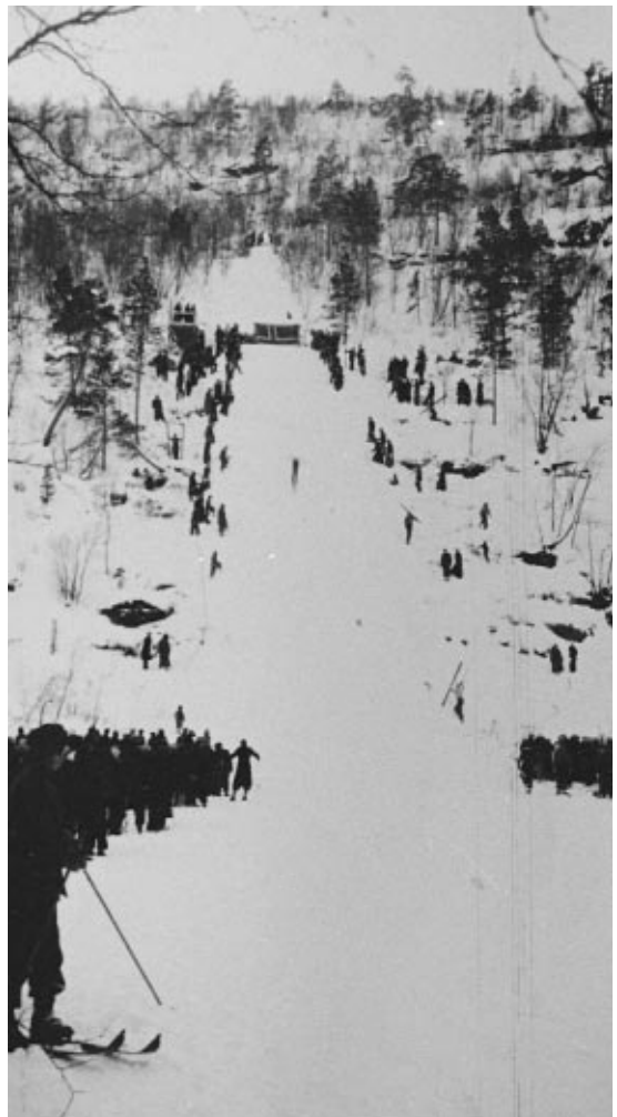
Isbergbakken på 1950-tallet.

«I hopprennet søndag omkranset hele 1000 tilskuere Isbergbakken. Under hopprennet benyttet de fleste løperne bil de 8 km fra Elvebakken, mens det for de mange tilskuere som møtte opp ble en herlig formiddagstur.»