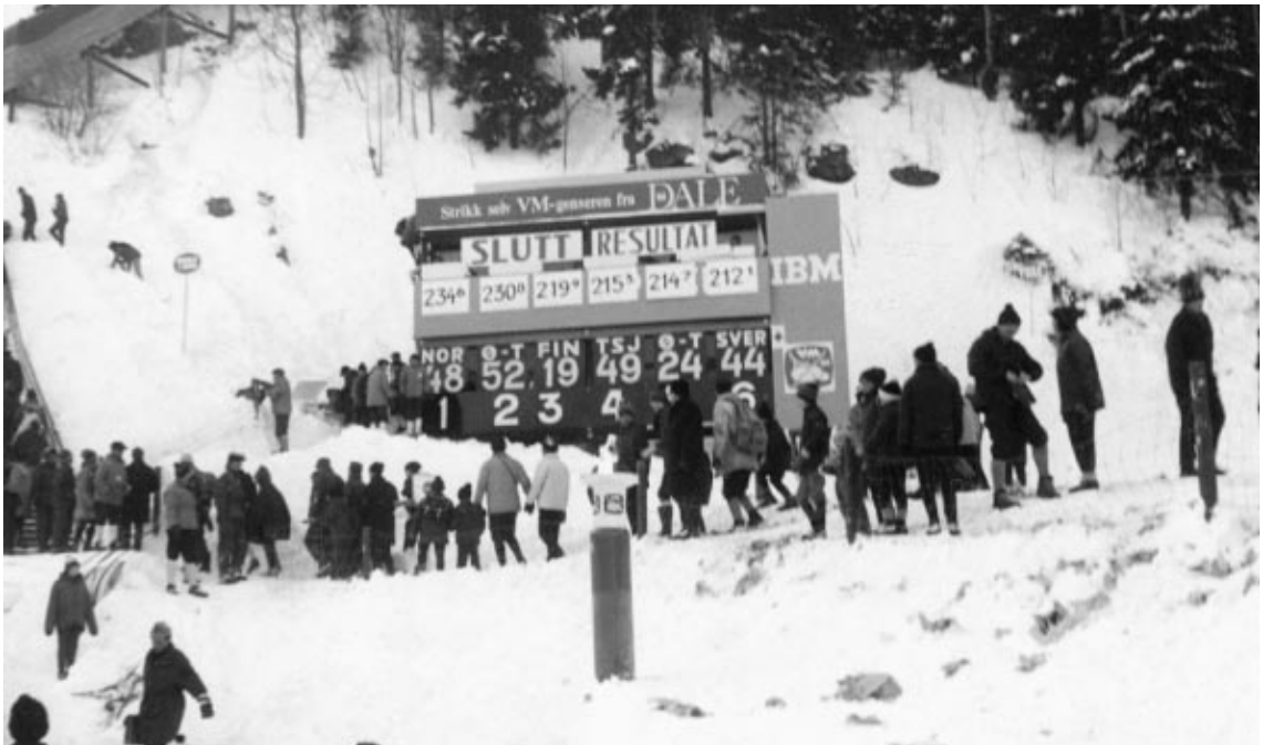
Fra VM i Midtstubbakken 19. februar 1966, der Bjørn Wirkola tok sin første VM-tittel. Tavla viser at nr. 1 er start nr. 48 fra NOR med 234,6 poeng.