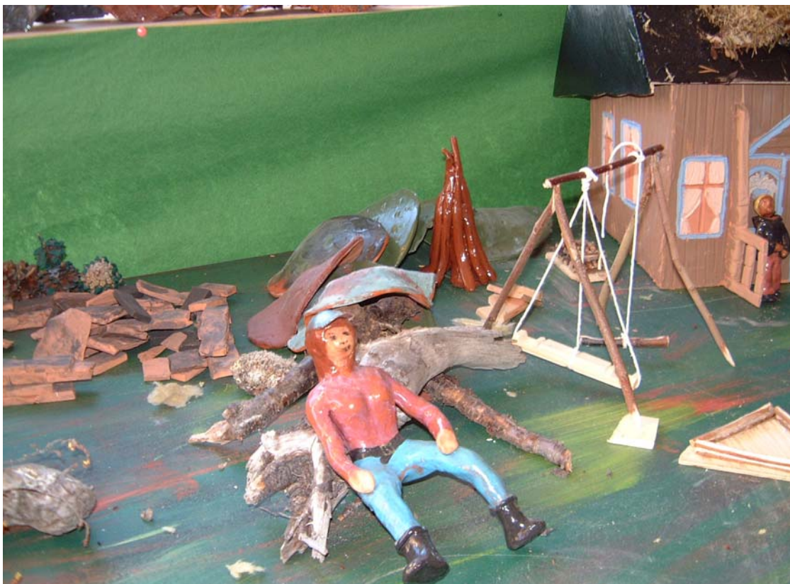
Pust i bakken