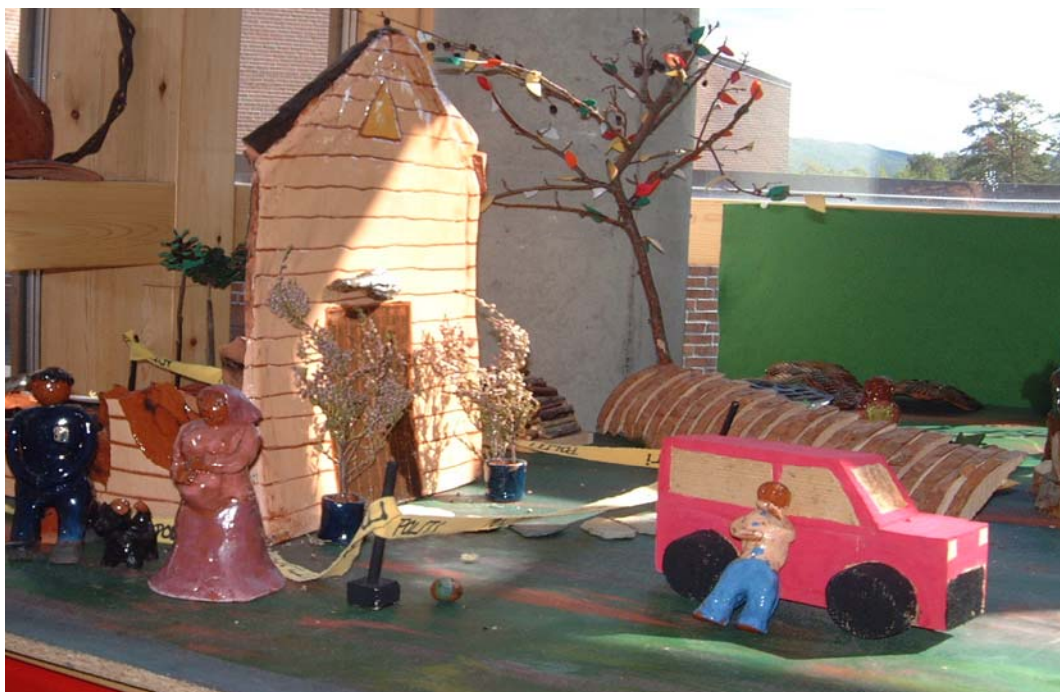
Huset som brant