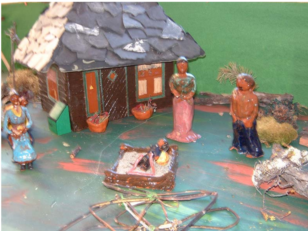
Lek i sandkassa