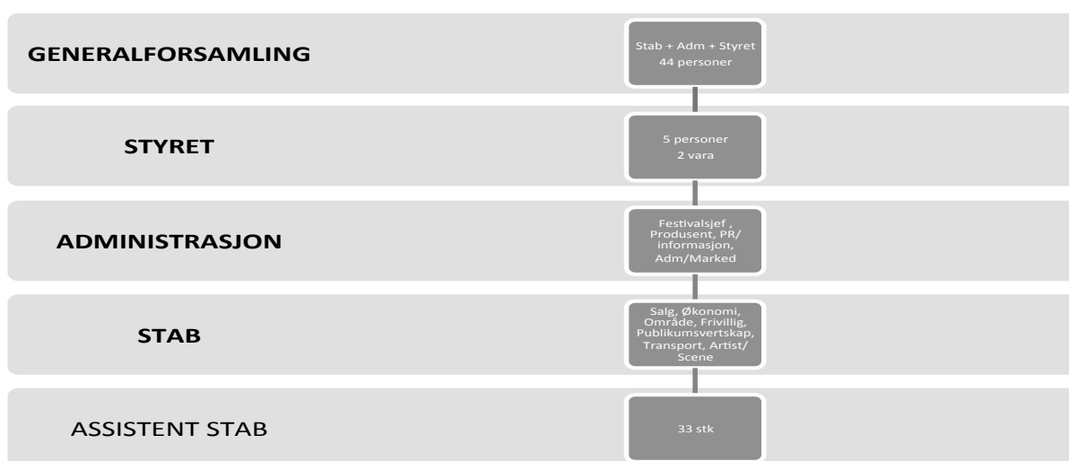
Figur 2 – Organisasjonskart, hierarkisk inndelt.

Som jeg var inne på i kapittel 3 er organisasjonen til Buktafestivalen delt inn i ulike fraksjoner. Disse fraksjonene kan rangeres hierarkisk, som vist ved figur 2 under. Organisasjonen er strukturert på en slik måte at arbeidsfordelingen mellom de ulike fraksjonene tydelig.