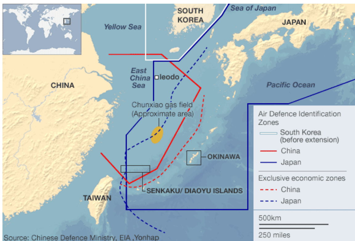
Figur 2:

Øyene har altså lenge vært et omstridt tema mellom nabostatene, og i løpet av de siste årene, spesielt siden 2012, har konflikten mellom Kina og Japan eskalert til nye høyder. Det hevdes at etter den japanske regjeringen i 2012 gikk inn for å kjøpe øyene av de private japanske eierne, satte det fyr i konflikten. Den kinesiske statsministeren Wen Jiabo gikk så ut med advarsel mot den japanske regjeringen, og fordømte kjøpet som «ulovlig og ugyldig» (Klassekampen 2012b). Kina har siden da aktivt gått inn for å innkreve øygruppen under deres herredømme. Konflikten omtales både som truende, farlig og sikkerhetsutfordrende i media.